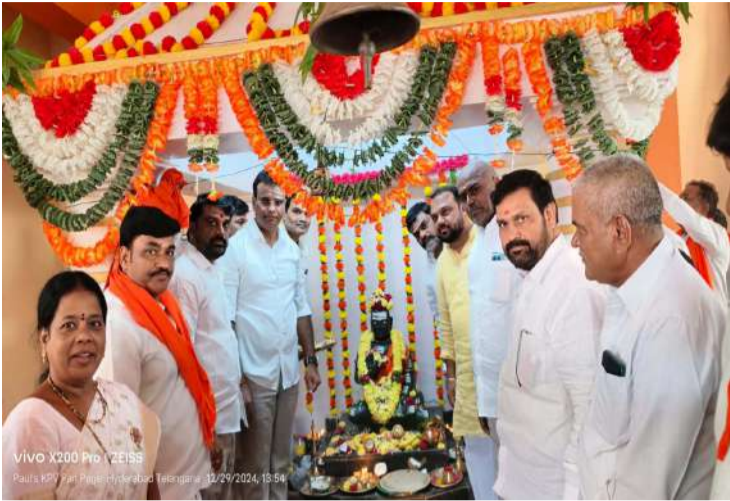
మేడల్ జిల్లా ప్రతినిధి ( ప్రజా జ్యోతి) డిసెంబర్ 29