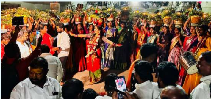
చేవెళ్ల డిసెంబర్ 29(ప్రజా జ్యోతి):

చేవెళ్ల మండల పరిధిలోని ధర్మసాగర్ గ్రామంలో బురుజు మైసమ్మ బోనాలను గ్రామస్తులు ఆదివారం ఘనంగా నిర్వహించారు. భక్తి శ్రద్ధలతో మహిళలు అమ్మ వారికి బోనాలు సమర్పించుకున్నారు. మహిళలు బోనాలతో గ్రామంలోని వీధుల గుండా ఊరేగింపుగా తీసుకెళ్లారు. బోనాల సందర్భంగా గ్రామంలో పండుగ వాతావరణం నెలకొంది. గ్రామస్తులు పెద్ద ఎత్తున అమ్మవారి దేవాలయం వద్దకు చేరుకుని అమ్మవారికి మొక్కులు చెల్లించుకొని ప్రత్యేక పూజలు నిర్వహించి అమ్మ ఆశీస్సులు గ్రామ ప్రజలపై ఉండాలని ప్రార్థించారు. ఈ కార్యక్రమంలో గ్రామస్తులు పాల్గొన్నారు.