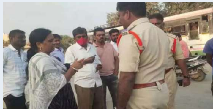
నాగర్ కర్నూల్, డిసెంబర్ 29 ప్రజా జ్యోతి

ఆర్టీసీ బస్సు ఎక్కిన ప్రయాణికురాలి బంగారం చోరీ అయిన సంఘటన నాగర్ కర్నూల్ జిల్లా పరిధిలోని బిజినపల్లి మండల కేంద్రంలో చోటు చేసుకుంది. స్థానికులు తెలిపిన వివరాల ప్రకారం బిజినపల్లి మండల కేంద్రంలోని జడ్పీహెచ్ఎస్ పాఠశాల లో ఉపాధ్యాయురాలిగా విధులు నిర్వహిస్తు మహిళ బిజినపల్లి నుండి జడ్పర్ల వెళ్లడానికి వనపర్తి నుంచి హైదరాబాద్ వెళ్లే బస్సు ఎక్కింది బస్సు ఎక్కిన క్రమంలో రద్దీ ఎక్కావగా ఉండడంతో తన చేతికి ఉన్న తులం బంగారు బ్రాస్లెట్ ను గుర్తు తెలియని వ్యక్తులు చోరీకి పాల్పడ్డారు. పోలీసులకు సమాచారం ఇవ్వడం తో పోలీసులు బిజినపల్లి బస్టాండ్ కు చేరుకొని బస్సులో ఉన్న ప్రయాణికులను చెక్ చేశారు. బ్రాస్ లైట్ దొరకపోవడంతో బస్సును పంపించారు. నిఘా నేత్రాలు పరిచయకపోవడంతోనే దొంగలు రెచ్చిపోతున్నారని ప్రయాణికులు వాపోతున్నారు వెంటనే ఆర్టీసీ అధికారులు స్పందించి నిఘా నేత్రాలను ఏర్పాటు చేయాలని ప్రయాణికులు కోరుతున్నారు.