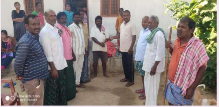
డిసెంబర్ 29 (ప్రజాజ్యోతి)