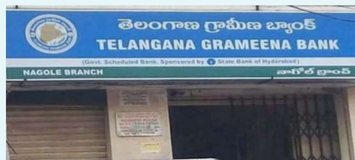
నాగర్ కర్నూల్, డిసెంబర్ 29 ప్రజా జ్యోతి

ఏపీజీవీబీ బ్యాంకు శాఖలు తెలంగాణ గ్రామీణ బ్యాంకులో విలీనం అవుతున్న నేపథ్యంలో డిసెంబర్ 28 నుండి డిసెంబర్ 31వ తేదీ వరకు బ్యాంకు లావాదేవీలు నిలిచిపోతున్నట్లు చైర్మన్ ప్రతాప్ రెడ్డి ఒక ప్రకటనలో తెలిపారు. 2025 జనవరి 01 నుంచి సేవలను పునరుద్ధరిస్తామని, బ్రాంచ్ ల విలీనం జరిగినా ఖాతా నెంబర్లు మారవని స్పష్టం చేశారు, ఖాతాదారుల అవసరాల నిమిత్తం ఈనెల 30, 31 తేదీల్లో రూ.10,000 వరకు డ్రా చేసుకునే అవకాశం కల్పిస్తున్నట్లు తెలిపారు.