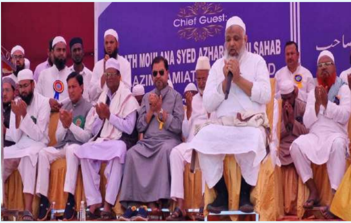
జహీరాబాద్, డిసెంబర్ 29 ( ప్రజా జ్యోతి న్యూస్)

- జమాతే హింద్ ప్రెసిడెంట్ మోలానా సయ్యద్ అజహర్ మదనీ