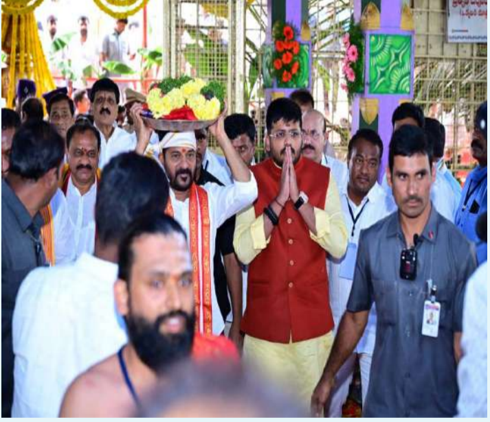
మెదక్ ( ప్రజాజ్యోతి )

- అడీషనల్ కమీషనర్ రాకతో అభివృద్ధికి సుస్థిర మార్గం - ఎమ్మెల్యే డా. మైనంపల్లి రోహిత్