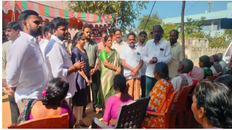
- శ్రీకృష్ణ సూపర్ స్పెషాలిటీ ఆసుపత్రి వారి ఆధ్వర్యంలో సుమారు 300 మందికి ఉచిత విద్య పరీక్షలు మందులు అందజేత