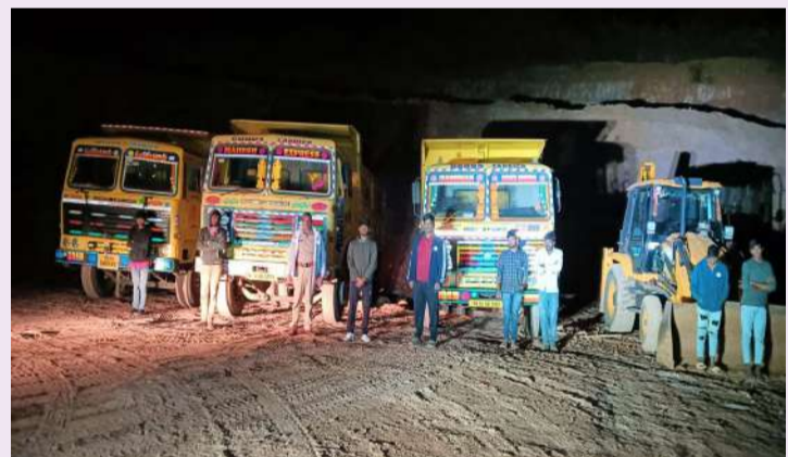
వికారాబాద్ ప్రతినిధి, డిసెంబర్ 29(ప్రజా జ్యోతి):

- ఏడుగురు వ్యక్తులను పట్టుకుని లారీలు జెసిబి ని సీజ్ చేసిన పోలీసులు