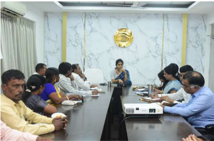
- జిల్లా కలెక్టర్ క్రాంతి వల్లూరు

సంగారెడ్డి, డిసెంబర్ 28, ప్రజా జ్యోతి న్యూస్ ప్రతినిధి :-