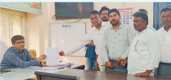
సిద్దిపేట ప్రజాజ్యోతి :