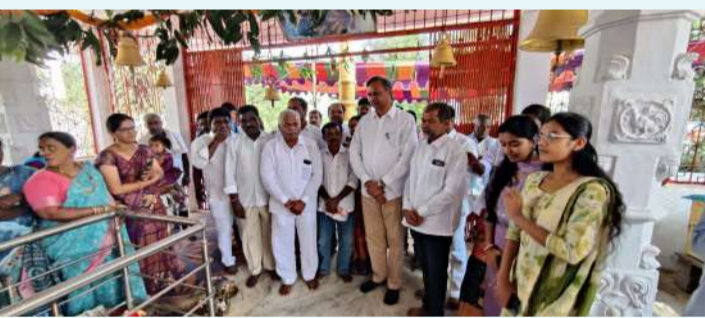
చేర్యాల ప్రజాజ్యోతి :