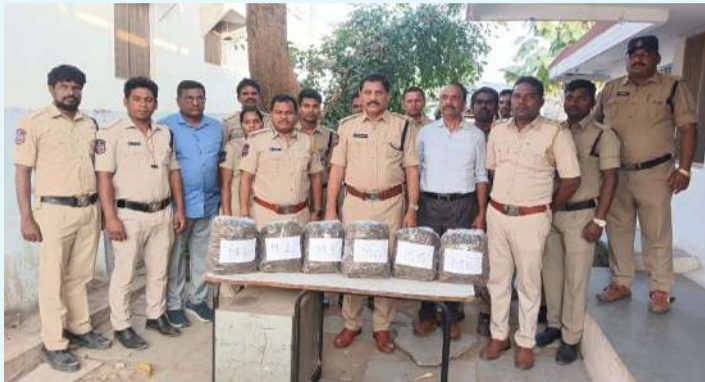
తాండూర్ డిసెంబర్ 28 ప్రజాజ్యోతి :-