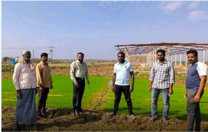
కల్వేర్. డిసెంబర్. 28. ప్రజా జ్యోతి