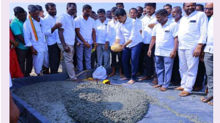
నాగర్ కర్నూల్, డిసెంబర్ 23 ప్రజా జ్యోతి