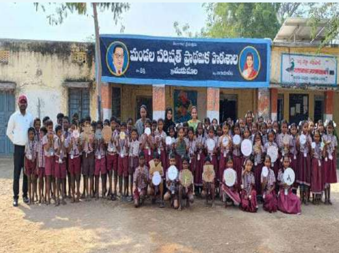
కృష్ణ మండలం పరిధిలోని ప్రజాజ్యోతి డిసెంబర్: 23