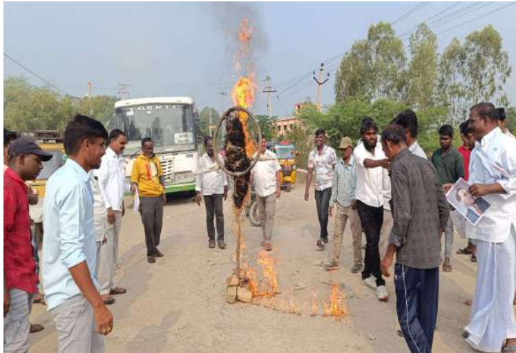
-మంత్రి పదవికి రాజీనామా చేయాలి