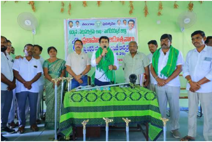
-రుణమాఫీ పథకం రైతులకు వరం