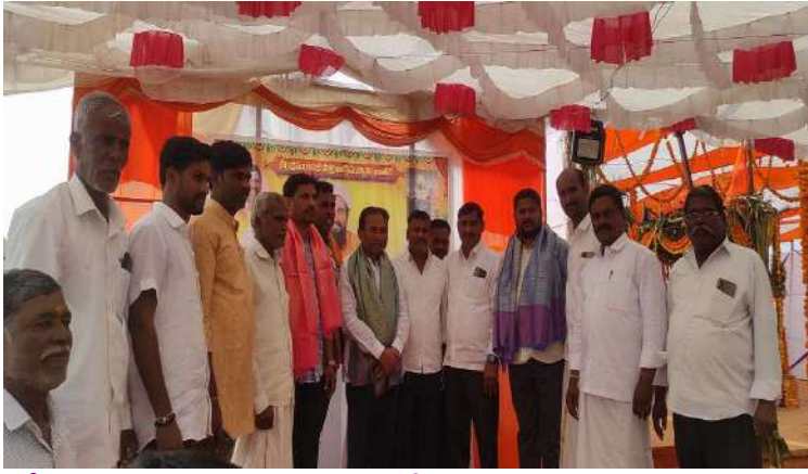
జహీరాబాద్, డిసెంబర్ 23 ( ప్రజా జ్యోతి న్యూస్ )