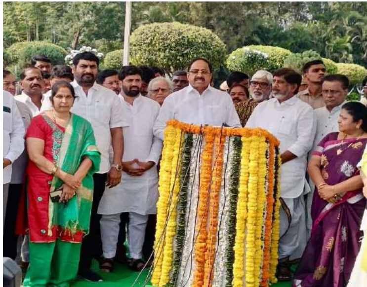
-రాష్ట్ర ముఖ్యమంత్రిగా, భారత ప్రధానిగా, అనేక మంత్రిత్వ శాఖలు నిర్వహించిన బహుముఖ ప్రజ్ఞాశాలి పి.వి. సేవలు చిరస్మరణీయం... - టీపీసీసీ అధికార ప్రతినిధి డా. సత్యం శ్రీరంగం...

కూకట్ పల్లి, డిసెంబర్ 23 (ప్రజా జ్యోతి) :