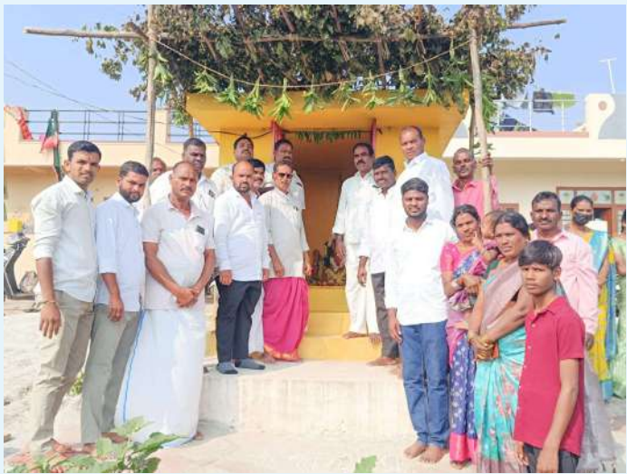
చేవెళ్ల డిసెంబర్ 23(ప్రజా జ్యోతి):