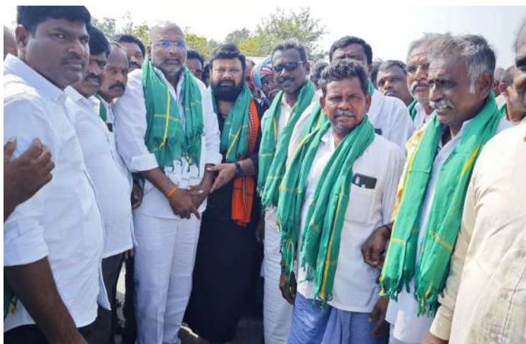
పూజ్య నియోజకవర్గ ప్రతినిధి, డిసెంబర్ 23 (ప్రజా జ్యోతి):