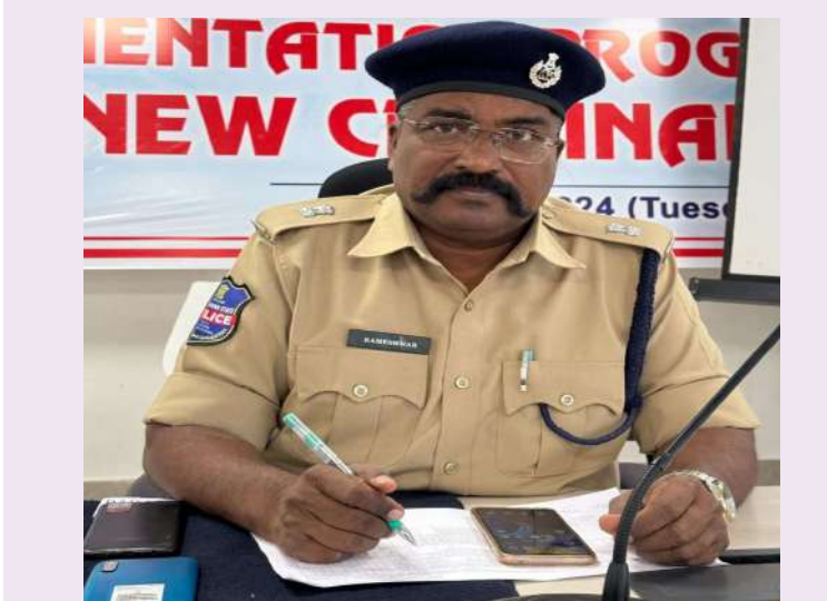
నాగర్ కర్నూల్, డిసెంబర్ 23 ప్రజా జ్యోతి

ప్రజా సమస్యల పరిష్కారం కోసం ఎస్ పి కార్యాలయం లో నిర్వహించే ప్రజావాణి కార్యక్రమంలో భాగంగా సోమవారం నిర్వహించిన పోలీస్ ప్రజావాణి కార్యక్రమానికి 13 ఫిర్యాదులు వచ్చాయని పోలీస్ అధికారులు ఒక ప్రకటనలో తెలిపారు. అడిషనల్ ఎస్పీ సి.హెచ్.రామేశ్వర్ స్వయంగా ఫిర్యాదుదారుల వినతులను స్వీకరించారు. అనంతరం అధికారులతో మాట్లాడుతూ ప్రజావాణి కార్యక్రమంలో వచ్చిన ఫిర్యాదులను తక్షణమే పరిష్కరించే విధంగా చర్యలు చేపట్టాలని ఆదేశించారు.