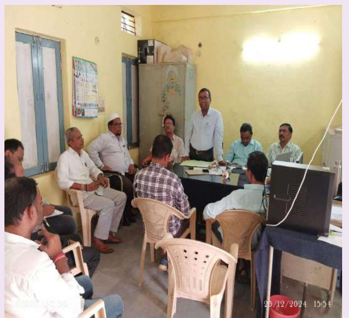
అల్లదుర్గం డిసెంబర్ 23 (ప్రజాజ్యోతి)