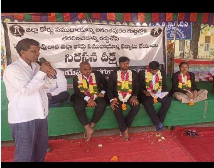
గద్వాల (ప్రజా జ్యోతి) డిసెంబర్ 23:

-పిజెపి క్యాంపులోనే కోర్టు స్థలాన్ని కేటాయించాలి -అందరికీ అనుకూలమైన స్థలం