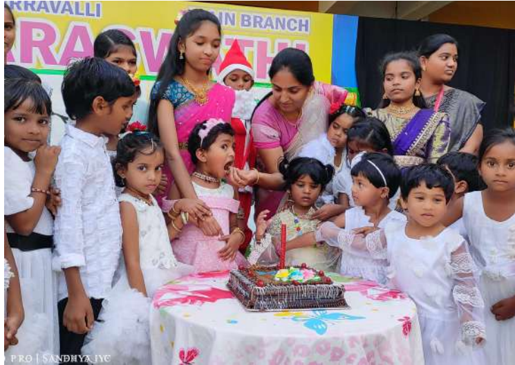
-దావీదు పట్టణమందు నేడు రక్షకుడు