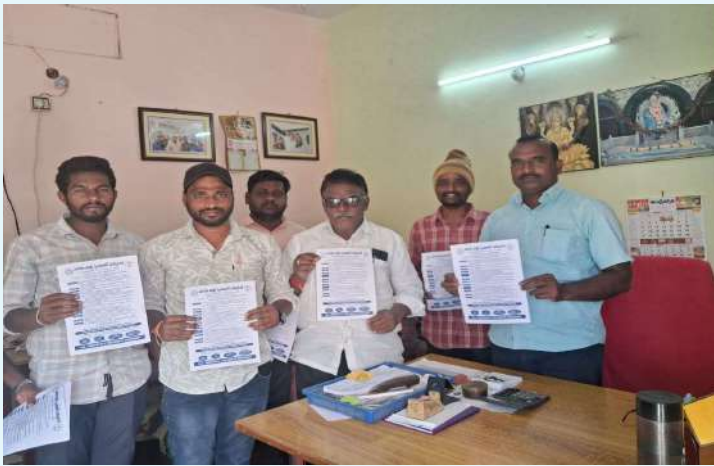
కోహడ డిసెంబర్.18(ప్రజా జ్యోతి)

కోహడ మండలంలో, లయన్ క్లబ్ ఆధ్వర్యంలో సురభి మల్టీ స్పెషాలిటీ హాస్పిటల్ (మిట్టపల్లి) సహకారంతో ఉచిత మెగా వైద్య శిబిరం నిర్వహించబడుతుంది. ఈ శిబిరం ఈ నెల డిసెంబర్ 24వ తేదీ, మంగళవారం, ఉదయం 9 గంటల నుండి సాయంత్రం 4 గంటల వరకు కోహడ వ్యవసాయ మార్కెట్ భవనంలో జరగనుంది. ఈ వైద్య శిబిరంలో అనుభవం కలిగిన 15 మంది వైద్య బృందం రోగులకు ఉచిత వైద్య పరీక్షలు నిర్వహించి, అవసరమైన మందులు అందిస్తారు. అంతేకాకుండా, అవసరమైన వారికి ఉచిత ఆపరేషన్ సేవలు కూడా అందించ బడతాయి. వైద్య సలహాలు, చికిత్సల వివరాలు కూడా అందించుస్తారు. కోహడ మండలంతో పాటు పరిసర ప్రాంత ప్రజలందరూ ఈ అవకాశాన్ని సద్వినియోగం చేసుకోవాలని నిర్వాహకులు విజ్ఞప్తి చేశారు. ఈ ఉచిత వైద్య శిబిరం స్థానిక ప్రజలకు ఆరోగ్య పరిరక్షణలో దోహదపడుతుందన్నారు.