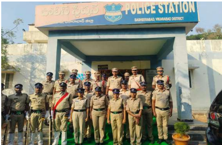
బషీరాబాద్ డిసెంబర్ 18 ప్రజా జ్యోతి