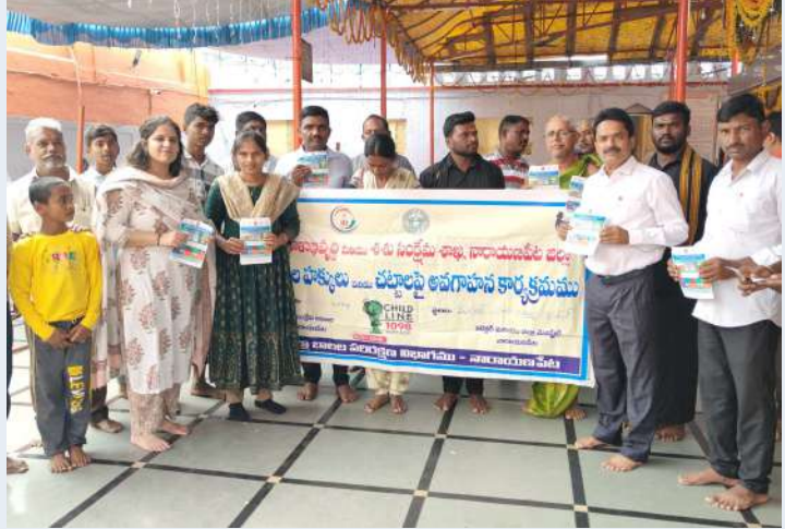
మఖల్ నియోజకవర్గ ప్రతినిధి, డిసెంబర్ 18 (ప్రజా జ్యోతి):

-బాలకార్మికుల, బాల్యవివాహాలపై మహిళా శిశు సంక్షేమ శాఖ ఆధ్వర్యంలో ప్రజలకు అవగాహన