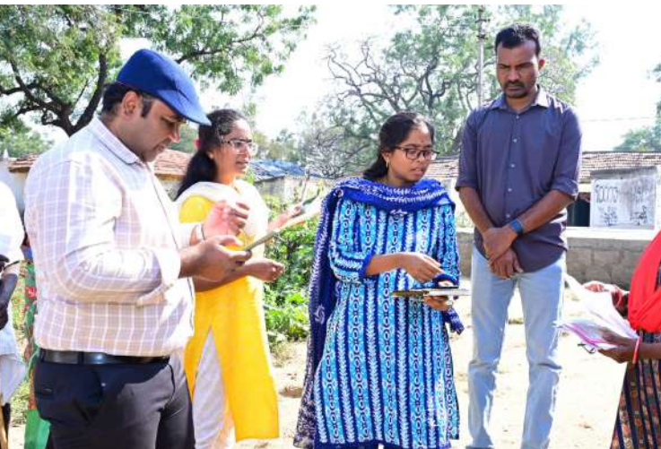
-ప్రభుత్వం నిర్దేశించిన మార్గదర్శకాలతో సర్వే జరగాలి