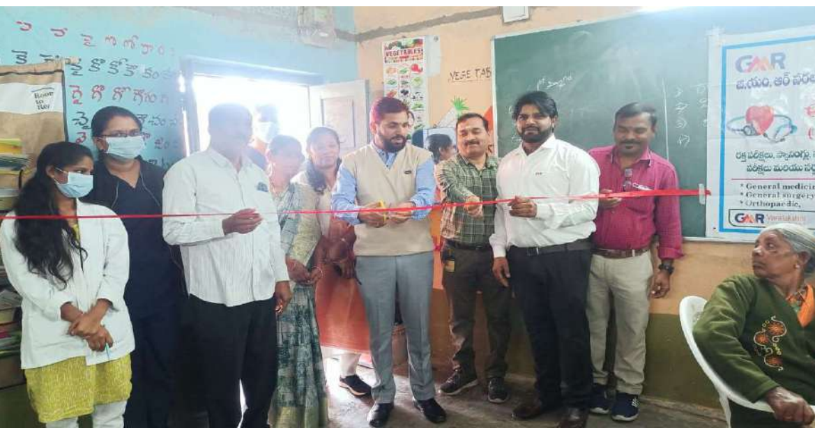
-జి.యం.ఆర్ వరలక్ష్మి ఫౌండేషన్ వారి ఆధ్వర్యంలో