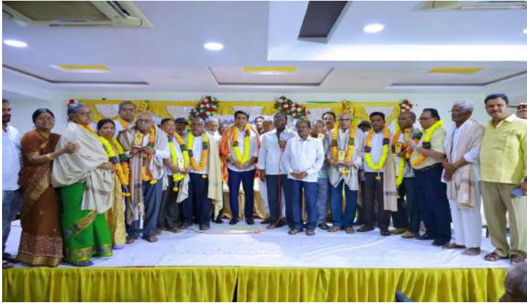
-ఎమ్మెల్యే కూచుకుళ్ళు రాజేష్ రెడ్డి