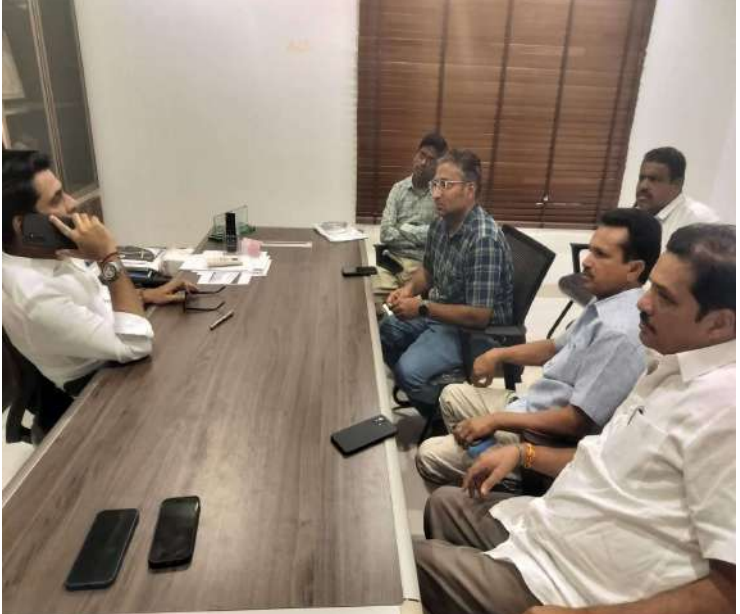
-ఎమ్మెల్యే కూచుకుళ్ళ రాజేష్ రెడ్డి

నాగర్ కర్నూల్ (టౌన్), డిసెంబర్ 17 ప్రజాజ్యోతి