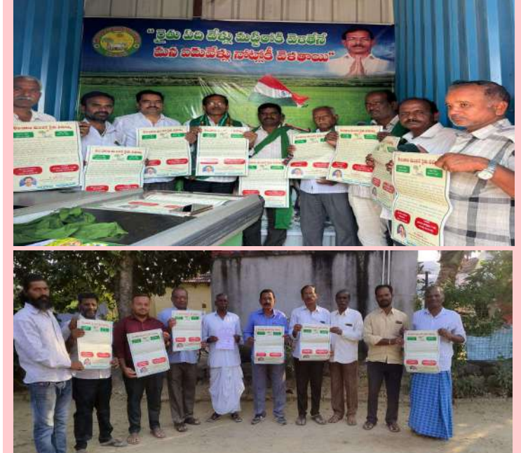
సంగారెడ్డి, డిసెంబర్ 17, ప్రజా జ్యోతి న్యూస్ ప్రతినిధి :-