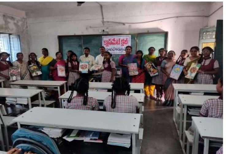
నాగర్ కర్నూల్, డిసెంబర్ 17 ప్రజా జ్యోతి

నాగర్ కర్నూల్ నియోజకవర్గం బిజినపల్లి మండల మండల కేంద్రంలోని జిల్లా పరిషత్ బాలుర మరియు బాలికలు ఉన్నత పాఠశాలతో పాటు మండల పరిషత్లోని మంగనూర్ జిల్లా పరిషత్ ఉన్నత పాఠశాలలో 120