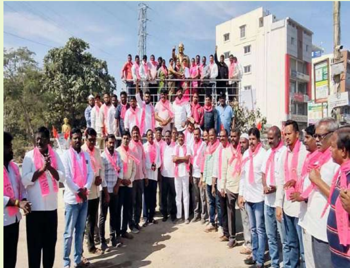
జడ్పర్ల డిసెంబర్ 17 (ప్రజా జ్యోతి)