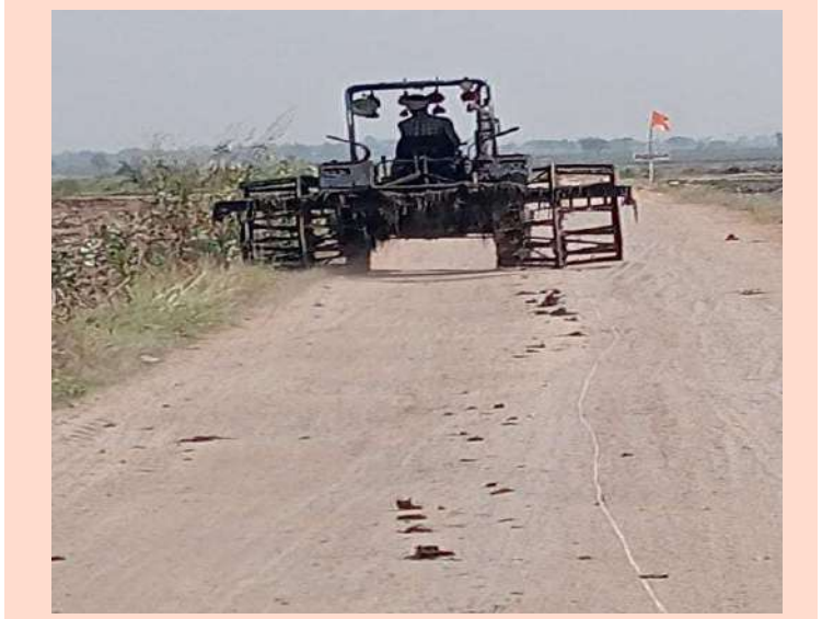
కృష్ణ మండలం ప్రతినిధి ప్రజాజ్యోతి డిసెంబర్ 17:

కృష్ణ మండలం పరిధిలోని టైరోడ్ నుండి మురహారి దొడ్డి కి వెళ్లే రహదారిలో కేజీవిల్ ట్రాక్టర్ లు టిప్పుర్లు వద్ద లారీలు తిప్పుడం వలనే రోడ్డు గుంతలు, గుంతలుగ, పడుతున్నాయి. ఇటీ రోడ్డుపై వెళ్లే వాహనలకు, పూర్తిగా ఇబ్బందులు ఎదుర్కొంటున్నారు. ఒక్కసారి వర్షం కురువగానే, టూ విల్లర్ వాహనాలకు, వెళ్లడానికి చాలా ఇబ్బందులు పడుతున్నాయి. వాహనదారులు ముదుమాల్, మురహారి దొడ్డికి వెళ్లే రోడ్డు పనికి రాక పోతున్నాయి అనే సమాచారం అందించారు. పక్కనే ఉన్నటువంటి పొలంలో తిప్పాల్సిన కేజీవిల్ ట్రాక్టర్ ను వెళ్లే రహదారి రోడ్డు మీద కేజీవిల్ ట్రాక్టర్ ను తిప్పుతున్నారు, కదా తిప్పగానే. ఉన్నా కాస్త రోడ్డు కూడా గుంతలు, గుంతలుగా పడుతుంది అని అన్నారు. అక్కడ ఉన్నటువంటి వాహనదారులు సమాచారం అందించారు, వాహన దారులు ఉన్న కాస్త రోడ్డు కూడా జాగ్రత్తగా కాపాడుకోవాలి అన్నారు.