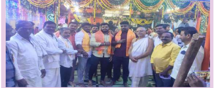
మల్తుల్ నియోజకవర్గ ప్రతినిధి, డిసెంబర్ 17 (ప్రజా జ్యోతి):