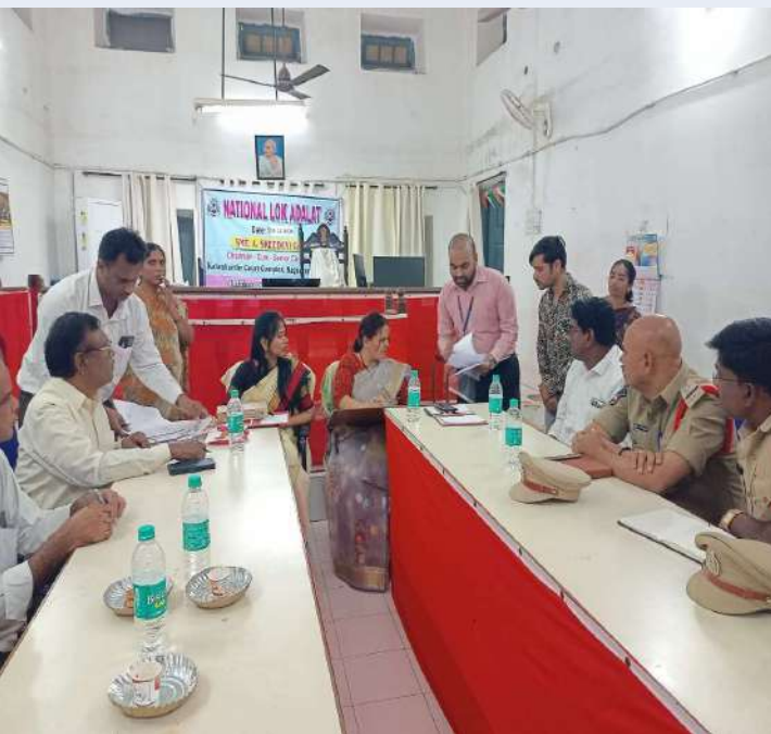
కల్వకుర్తి డిసెంబర్ 14 ( ప్రజా జ్యోతి):