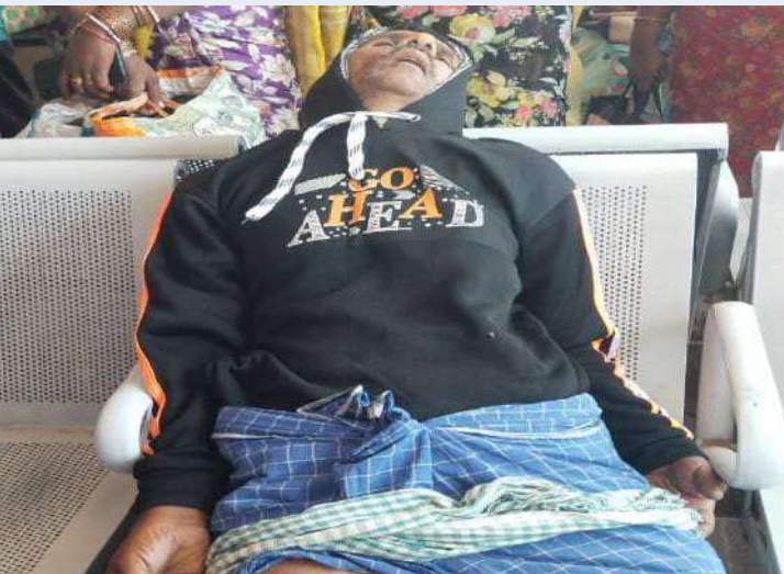
చేవెళ్ల డిసెంబర్ 14(ప్రజా జ్యోతి):