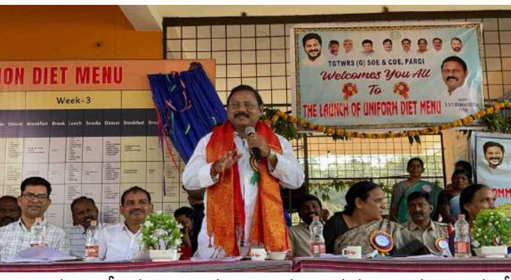
40 శాతం ఛార్జీలను పెంచారని అన్నారు. కావున విద్యార్థులు విద్యతో పాటు ఆరోగ్యం మరియు అన్ని రంగాల్లో అభివృద్ధి చెందాలనే ఉద్దేశ్యంతోనే ఈ నిర్ణయం తీసుకున్నాం అని తెలిపారు. దేవుడు అందరికీ సమాన మేధస్సు ఇచ్చారని కావున ఇలాంటి వసతులు అందరూ వినియోగించుకొని ఒక లక్ష్యం పెట్టుకొని చదువుకోవాలని తెలిపారు. ప్రస్తుతం ప్రభుత్వం కల్పిస్తున్న సౌకర్యాలను వాడుకొని మీరు ఉన్నత శిఖరాలకు చేరాలని తెలిపారు. పేదరికం విద్య కు ఇబ్బంది కాకూడదు అని ప్రభుత్వ సంకల్పం అని, ఏ అవసరమున్న తన దృష్టికి తెస్తే పరిష్కరిస్తానని తెలిపారు.