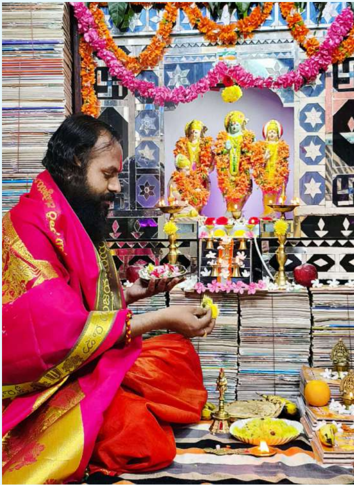
రాయపోల్ డిసెంబర్ 14 ప్రజా జ్యోతి