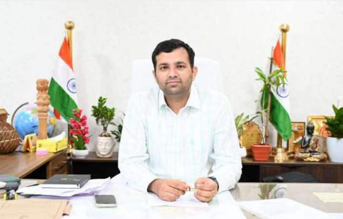
కొడంగల్ డిసెంబర్ 14 ప్రజా జ్యోతి స్టూన్స్:

కొడంగల్ మండలము, అప్పాయిపల్లి గ్రామ శివారులో గల సర్వే నెంబర్ 19 లో ప్రభుత్వ మెడికల్ కాలేజీ మరియు వెటర్నరీ కళాశాల ఏర్పాటు కొరకు తమ భూములను స్వచ్ఛందంగా ఇచ్చిన రైతులకు DTCP LAYOUT లో ఒక ఎకరానికి 125 గజాల చొప్పున ఉచితముగా రిజిస్ట్రేషన్ లు వచ్చే వారమునుండి చేస్తారని వికారాబాద్ జిల్లా కలెక్టర్, ప్రతిక్ జైన్ ఒక ప్రకటన లో తెలిపారు.