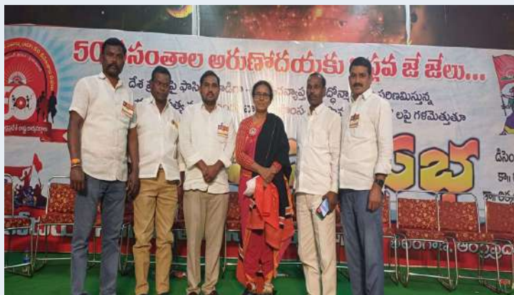
కొడంగల్ డిసెంబర్ 14 ప్రజా జ్యోతి స్టూన్స్: