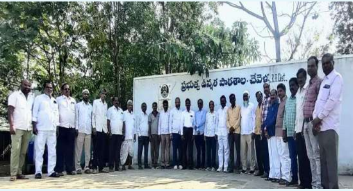
చేవెళ్ల డిసెంబర్ 14(ప్రజా జ్యోతి):

చేవెళ్ల మండల కేంద్రంలో 1955 వ సంవత్సరంలో ప్రారంభమైన జిల్లా పరిషత్ ఉన్నత పాఠశాల రాబోయే 2025వ సంవత్సరానికి 70 వసంతాలు పూర్తవుతున్న సందర్భంగా చదివిన బడి పై మమకారంతో పూర్వ విద్యార్థులు సర్వోత్తమ వేడుకలు చేయడానికి సిద్ధమయ్యారు. చేవెళ్ల పాఠశాలలో చదివిన నాటి పూర్వ విద్యార్థులు రాజకీయ ఉద్యోగ ఉపాధి రంగాల్లో స్థిరపడ్డారు. చదువు నేర్చి బాల్యం గడిపిన పాఠశాలలో నాటి నుంచి ఆ స్కూల్లో ఏదో ఒక సంవత్సరం చదివిన విద్యార్థులందరిని కలుపుకొని పాఠశాల స్వర్ణోత్సవాలు జరపాలని నిర్ణయించారు. పూర్వ విద్యార్థులకు జడ్.పి.హెచ్.ఎస్ పాఠశాలలో శనివారం చర్చ వేదిక ఏర్పాటు చేశారు. త్వరలో జరగనున్న పాఠశాల స్వర్ణోత్సవ కార్యక్రమాలలో భాగంగా సన్నాహక సమావేశంలో పలు తీర్మానాలు చేశారు. సర్వోత్తమ వాళి నెలలో నిర్వహిస్తామని జనవరి నెల రెండో శనివారం పూర్వ విద్యార్థులందరూ సమావేశంలో పాల్గొనాలన్నారు. ఈ కార్యక్రమంలో పూర్వ విద్యార్థులు పాల్గొన్నారు.