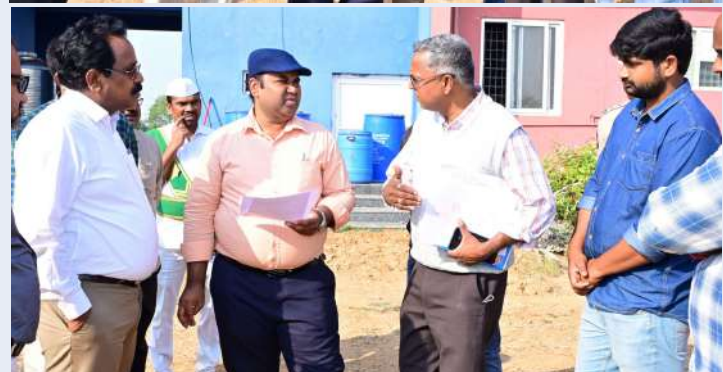
కొడిపల్లి ప్రజా జ్యోతి, డిసెంబర్-14

మండల పరిధిలోని తునికి కృషి విజ్ఞాన కేంద్రం ఉపరాష్ట్రపతి పర్యటన నేపథ్యంలో ఏర్పాట్లను పరిశీలించిన జిల్లా కలెక్టర్ రాహుల్ రాజ్ శనివారం క్షేత్రస్థాయి పర్యటనలో భాగంగా మెదక్ జిల్లా కొడిపల్లి మండలం కృషి విజ్ఞాన కేంద్రాన్ని అదనపు కలెక్టర్ నగేష్ తో కలిసి కలెక్టర్ పరిశీలించారు. ఉపరాష్ట్రపతి జగదీష్ ధన్ ఖద్ ఈనెల 25న మెదక్ జిల్లా కొడిపల్లి మండలం తునికి శివారులోని గ్రామీణ వికాస్ ఫౌండేషన్ ఏకలవ్య కృషి విజ్ఞాన కేంద్రానికి రానున్నారని విజ్ఞాన కేంద్రం నిర్వాహకులు చేస్తున్న ఏర్పాట్ల వివరాలను అడిగి తెలుసుకున్నారు. సేంద్రియ విధానం ద్వారా సాగు చేస్తున్న పంటలు వివరాలు రైతులతో ముఖాముఖి కార్యక్రమాలు ఏ విధంగా ఏర్పాటు చేస్తున్నారని నిర్వాహకులను అడిగి తెలుసుకున్నారు. కృషి విజ్ఞాన కేంద్రం శాస్త్రవేత్తలు తదితరులు పాల్గొన్నారు.