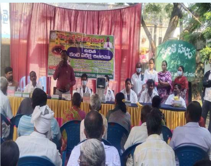
చిన్నకోడూర్ ,డిసెంబర్ 14 (ప్రజా జ్యోతి):