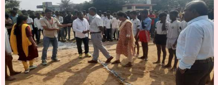
కొల్చారం (ప్రజా జ్యోతి ) డిసెంబర్ 10: