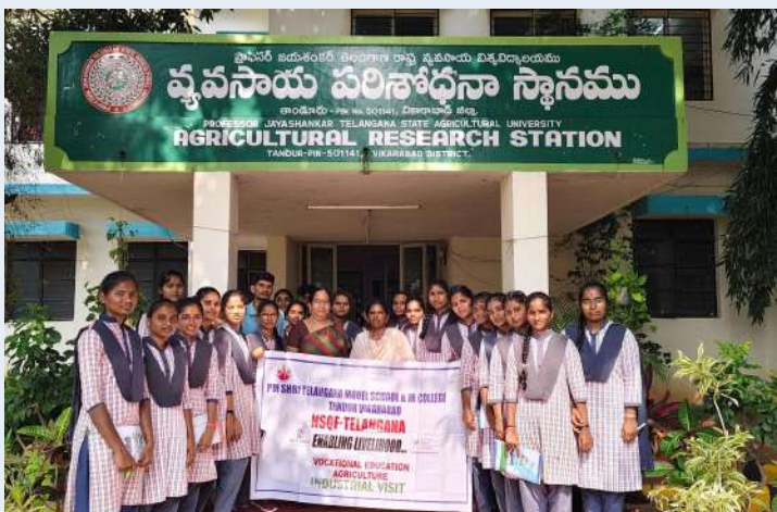
తాండూర్ డిసెంబర్ 10 ప్రజా జ్యోతి:

-వ్యవసాయ పరిశోధన కేంద్రాన్ని సందర్శించిన మోడల్ స్కూల్ విద్యార్థులు