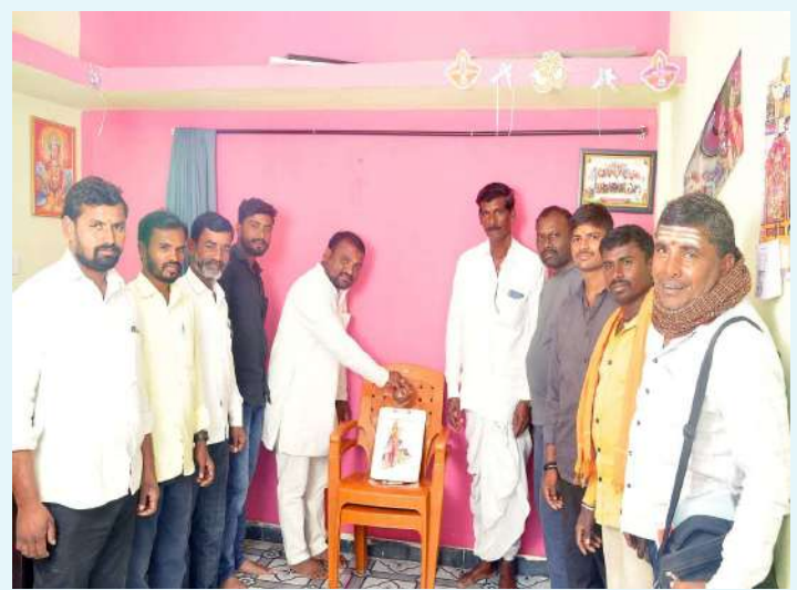
జహీరాబాద్, డిసెంబర్ 10 (ప్రజా జ్యోతి స్పూస్ )

- న్యాల్యల్ మండలం మల్లి గ్రామ బిఆర్ఎస్ పార్టీ నాయకుల విమర్శలు