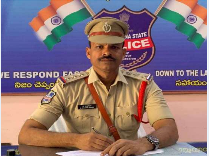
ముఖ్య్ నియోజకవర్గ ప్రతినిధి, డిసెంబర్ 10 (ప్రజా జ్యోతి)