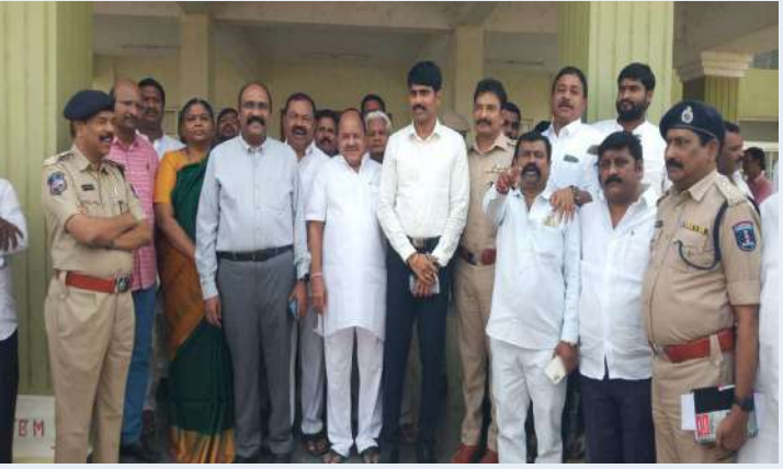
అబ్దుల్లాపూర్ మెట్టు డిసెంబర్ 10 (ప్రజా జ్యోతి)