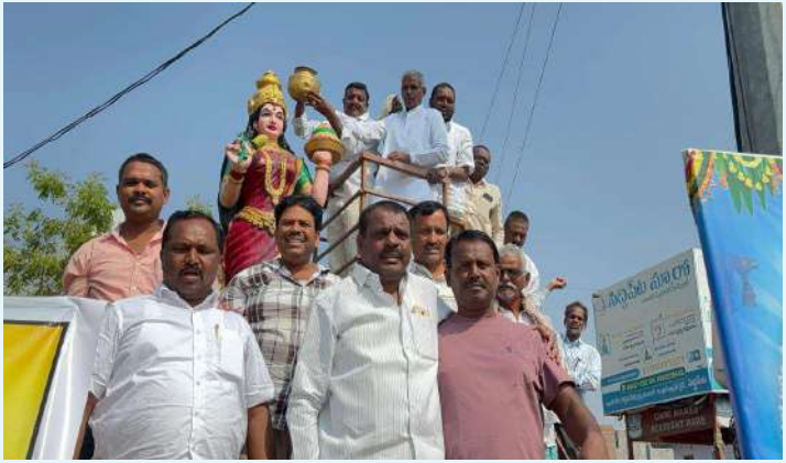
సిద్దిపేట (దుబ్బాక) ప్రజాజ్యోతి :