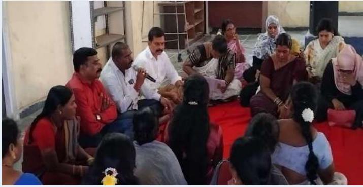
పరిగి, డిసెంబర్ 10 (ప్రజాజ్యోతి):