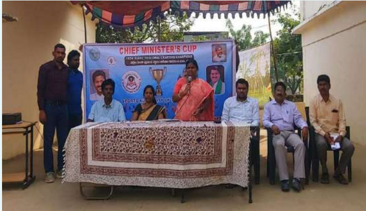
యాచారం, డిసెంబర్ 10 (ప్రజాజ్యోతి):