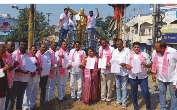
ప్రజాజ్యోతి నిజామాబాద్ ప్రతినిధి: లగచర్ల రైతుల ఆక్రమ అరెస్టులు మరియు