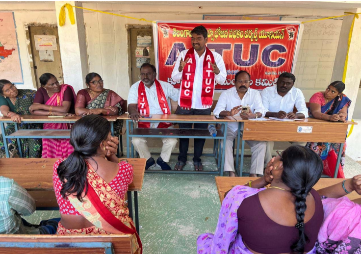
-తోట రామాంజనేయులు -కార్మికులకు కనీస వేతనాన్ని అందజేయాలి: నిమ్మటూరి