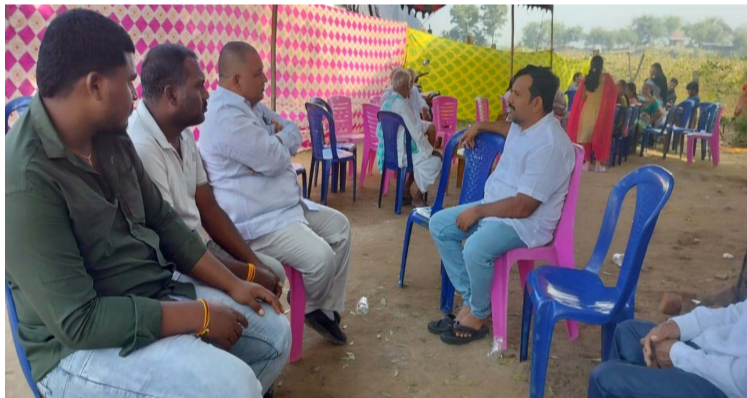
తల్లాడ, డిసెంబర్ 29 (ప్రజా జ్యోతి న్యూస్):