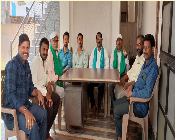
కారేపల్లి, డిసెంబర్ 29, ప్రజా జ్యోతి: