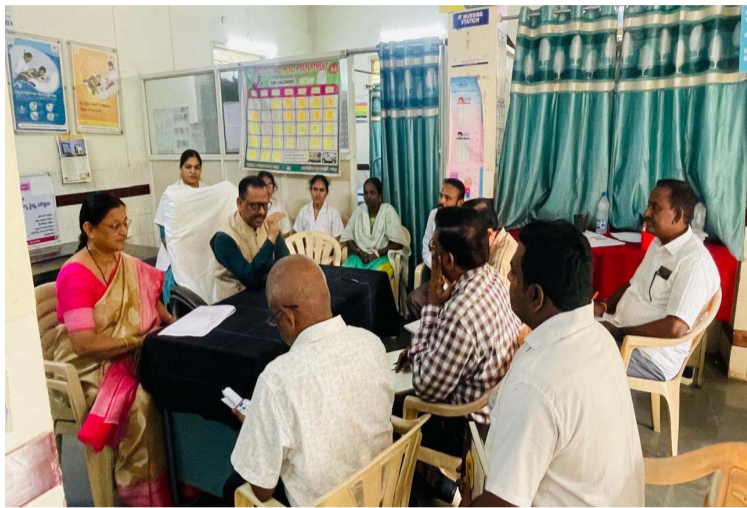
ఖమ్మం ప్రతినిధి ప్రజా జ్యోతి