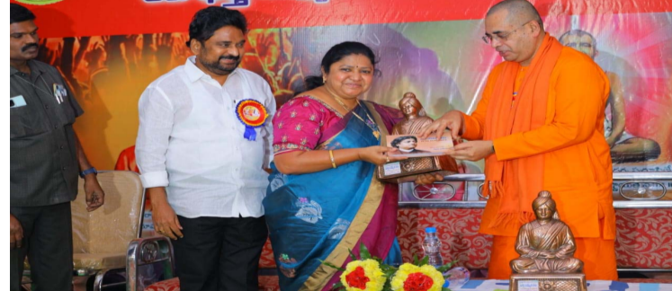
సత్తుపల్లి డిసెంబర్ 28 ప్రజా జ్యోతి.