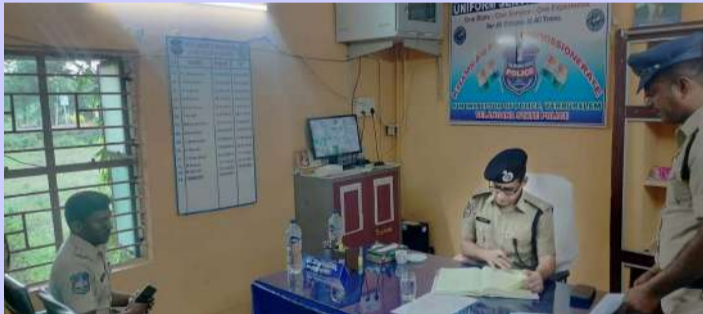
ఖమ్మం ప్రతినిధి ప్రజా జ్యోతి

ఎరుపాలెం పోలీస్ స్టేషన్ ను పోలీస్ కమిషనర్ సునీల్ దత్త సందర్శించారు. గురువారం సాయంత్రం పోలీస్ స్టేషన్ కు చేరుకున్న పోలీస్ కమిషనర్ స్టేషన్ నిర్వహణ, పోలీసుల పనితీరు, సెక్టార్ అధికారుల విచారణ నివేదికలు, జనరల్ డైరీ రికార్డులను పరిసరాలను పరిశీలించారు. పిటిషన్ విచారణలకు సంబంధించి సిబ్బందితో మాట్లాడారు. పోలీస్ స్టేషన్ పరిధిలో నమోదు అయిన కేసులు, డయల్ 100 కాల్స్ ప్రతిస్పందన సమయం, సస్పెక్ట్ షీట్లు, పెండింగ్ కేసులు పరిశీలించారు. అదేవిధంగా సరిహద్దుల నుండి అక్రమ రవాణా ను నియంత్రించేందుకు స్పెషల్ డ్రైవ్ నిర్వహిస్తూ.. వాహనాల తనిఖీలు ముమ్మరం చేయాలని అన్నారు. స్టేషన్ హౌస్ మేనేజ్మెంట్, పోలీస్ స్టేషన్ నిర్వహణ, సెక్టార్ ఆఫీసర్ల భాధ్యతలు, రెగ్యులర్ రోల్ కాల విధిగా అమలు చేయాలని సూచించారు. పెట్రో కార్, బీట్ ద్యూటీ సిబ్బంది ఏవిధమైన విధులు నిర్వహిస్తున్నారు? పాత నేరస్థుల నివాసాలను కదలికలను ఏవిధంగా గుర్తిస్తున్నారో అడిగి తెలుసుకున్నారు.