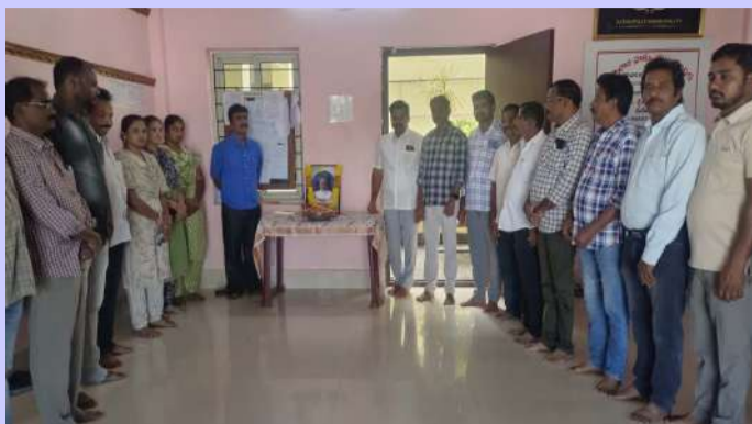
సత్తుపల్లి డిసెంబర్ 27 ప్రజా జ్యోతి.