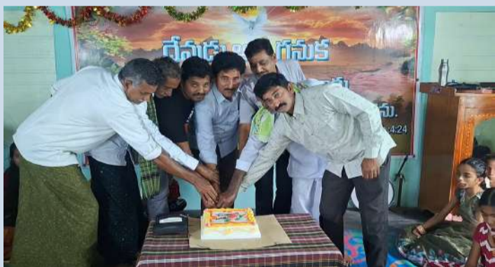
తల్లాడ, డిసెంబర్ 25 (ప్రజా జ్యోతి స్టూన్):