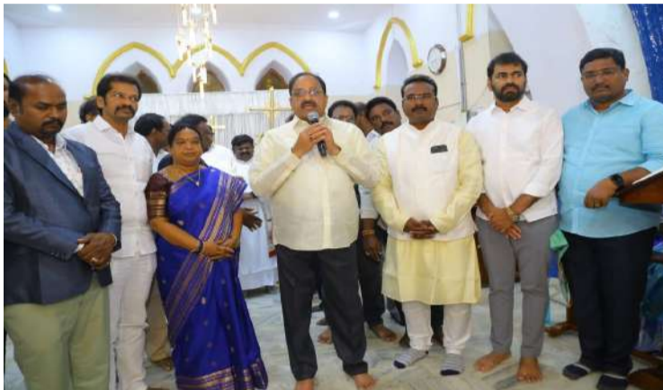
మైనారిటీలు, ప్రజాప్రతినిధులు, తదితరులు పాల్గొన్నారు.