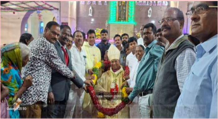
ఖమ్మం ప్రతినీధి ప్రజా జ్యోతి