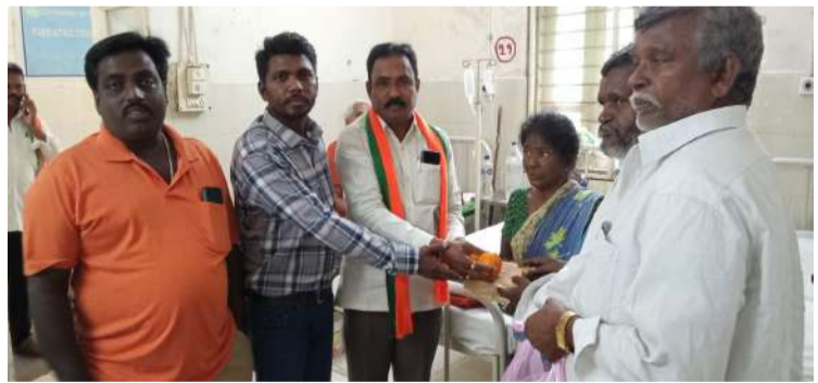
పెనుబల్లి, డిసెంబర్ 25, (ప్రజాజ్యోతి):