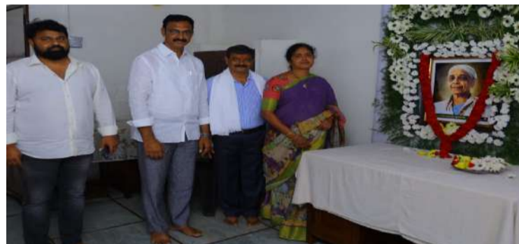
పాలేరు డిసెంబర్ 25 ప్రజా జ్యోతి