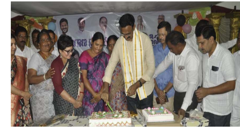
నేలకొండపల్లి ఖమ్మం రూరల్ తిరుమలయపాలెం మండలాల తాసిల్దార్ లు ఈ కార్యక్రమంలో పాల్గొన్నారు.