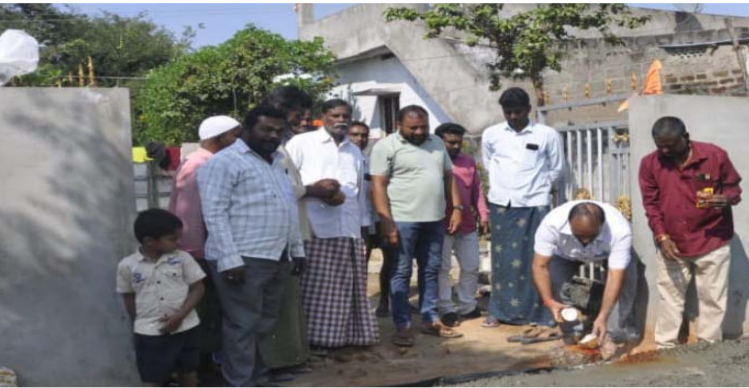
పాలేరు డిసెంబర్ 21 ప్రజా జ్యోతి