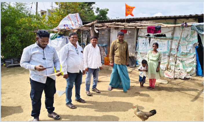
పాలేరు డిసెంబర్ 21 ప్రజా జ్యోతి