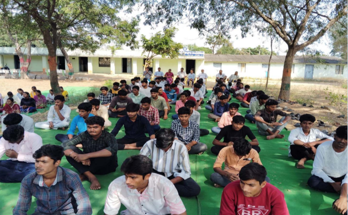
తిరుమలాయపాలెం, డిసెంబర్ 21, ప్రజా జ్యోతి :