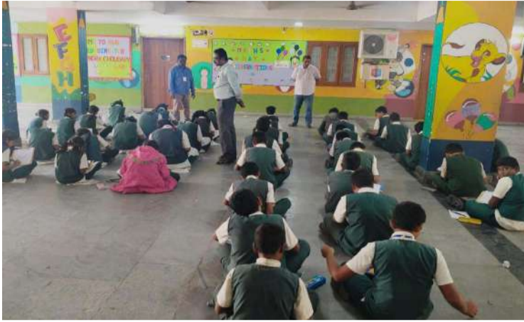
ఖమ్మం ప్రతినిధి ప్రజా జ్యోతి

జాతీయ గణిత దినోత్సవాన్ని పురస్కరించుకొని గత రెండు రోజులుగా ఖమ్మం నగరంలోని త్రివేణి పాఠశాలలో మ్యాథ్స్ ఫెస్ట్ నిర్వహించడం జరుగుతుంది. ఇందులో భాగంగా విద్యార్థిని విద్యార్థుల చేత రామానుజన్ నంబర్ నమూనాను, విద్యార్థులు వరుసలుగా నిలబడి రూపొందించడం, గణిత శాస్త్రానికి సంబంధించి శ్రీనివాస రామానుజన్ కి సంబంధించినటువంటి అంశాలతో వ్యాసరచన, ఉపన్యాస పోటీలు నిర్వహించడం జరిగింది. ఈరోజు కార్యక్రమంలో భాగంగా గణిత శాస్త్రం పైన క్వీజ్, రామానుజన్ టాలెంట్ టెస్ట్, మ్యాథ్స్ టేబుల్స్, రామానుజన్ చిత్రపటం గీయడం మొదలైన అంశాల్లో విద్యార్థిని విద్యార్థులకు పోటీలు నిర్వహించడం, ఇందులో భాగంగా క్వీజ్ కాంపిటీషన్లో బ్లూ, రెడ్ హౌస్ కు సంబంధించిన విద్యార్థులు గెలుపొందడం జరిగింది. ఈ కార్యక్రమంలో పాల్గొన్న పాఠశాల డైరెక్టర్ మాట్లాడుతూ గణిత శాస్త్రము సర్వశాస్త్రములకు తల్లి వంటిదనీ, గణితంలో ఎవరైతే చక్కని ప్రతిభ కనబరుస్తారో వారు జీవితంలో అత్యంత ఉన్నత స్థానాలను అధిరోపించగలుగుతారని, సర్వశాస్త్రాలను సులభంగా నేర్చుకోగలుగుతారని అన్నారు. పాఠశాల