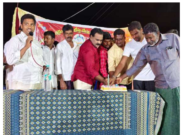
పాలేరు డిసెంబర్ 24 ప్రజా జ్యోతి