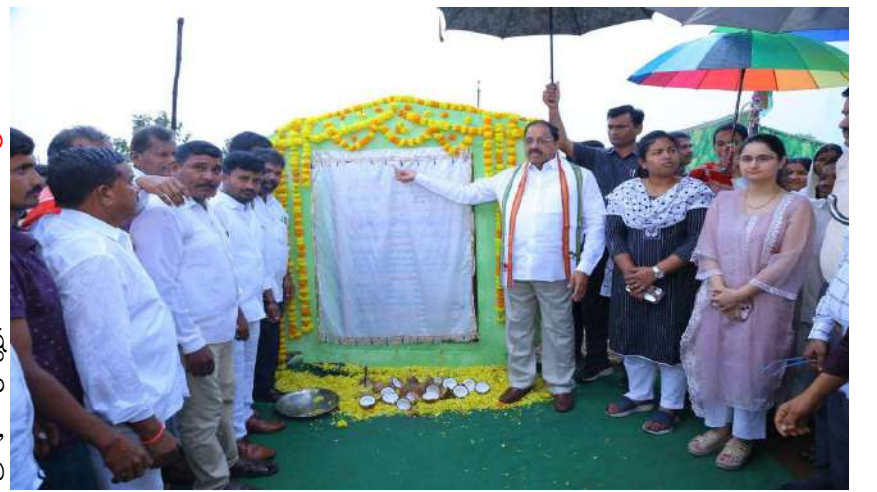
ఖమ్మం ప్రతినిధి ప్రజా జ్యోతి

- రాష్ట్ర వ్యవసాయ, మార్కెటింగ్, సహకార, చేనేత, జౌళి శాఖామాత్యులు తుమ్మల నాగేశ్వర రావు - రఘునాథపాలెం మండలంలో పలు సిసి రోడ్డు నిర్మాణ పనులకు శంకుస్థాపన చేసిన మంత్రి తుమ్మల నాగేశ్వర రావు