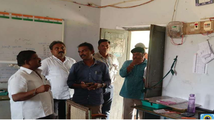
తండా, ఎర్రబోడు, ఈ గ్రామ పంచాయతీలలో, పోలింగ్ బూతులు పరిశీలించి, పంచాయతీ కార్యదర్శులకు, పలుసూచనలు చేశారు. ఈ కార్యక్రమములో సంబంధిత పంచాయతీ కార్యదర్శులు, ప్రాథమిక పాఠశాల ప్రధానోపాధ్యాయులు,తదితరులుపాల్గొన్నారు.