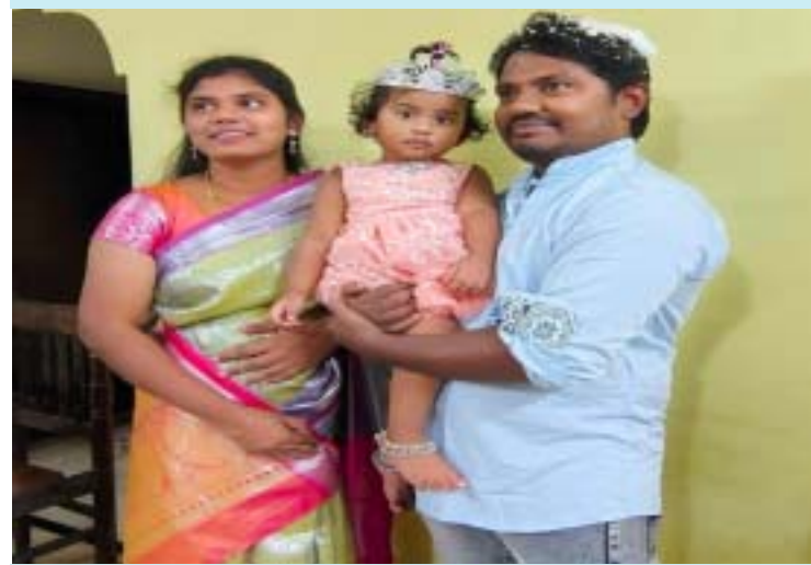
తల్లాడ, డిసెంబర్ 2 (ప్రజా జ్యోతి న్యూస్):

--అవయవదానం చేసి మానవత్వం చాటుకున్న కుటుంబ సభ్యులు..