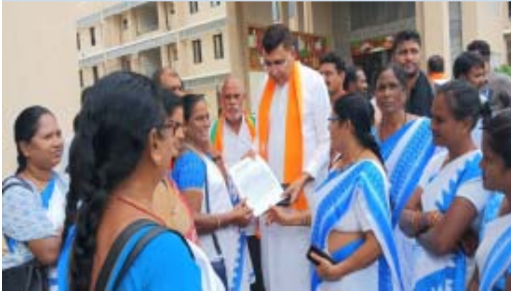
ఖమ్మం ప్రతినిధి ప్రజా జ్యోతి