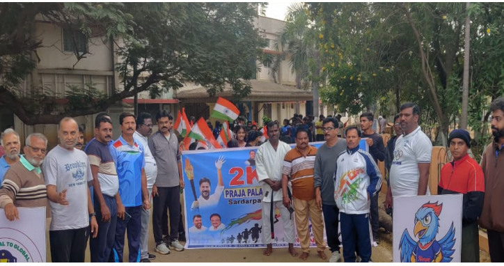
ఉద్యోగులు, ప్రజలు, తదితరులు పాల్గొన్నారు.