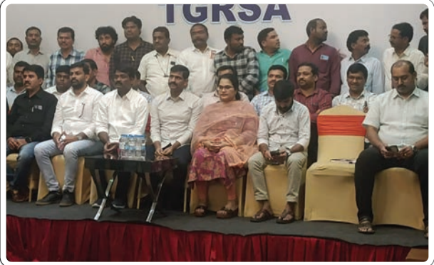
ములకలపల్లి డిసెంబర్ 08 ప్రజాజ్యోతి:

హైదరాబాద్ లోని అశోక హోటల్ లో ఆదివారం జరిగిన తెలంగాణ రెవెన్యూ సర్వీస్ అసోసియేషన్ రాష్ట్ర స్థాయి ఆస్థ్రీయ సమావేశానికి జిల్లాకు చెందిన ముప్పై మందికి పైగా రెవెన్యూ శాఖ లోని వివిధ సంఘాలలో పని చేస్తున్న తహశీల్దార్లు నాయబ్ తహశీల్దార్లు ఆర్