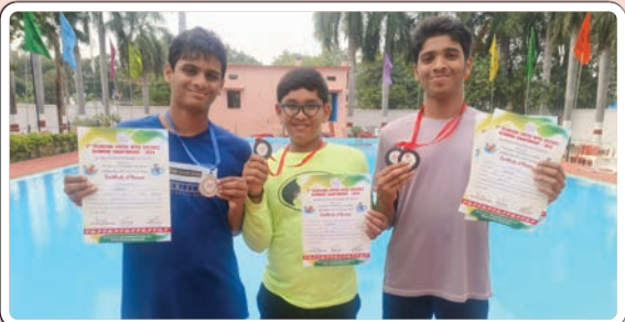
లక్ష్మీదేవిపల్లి, డిసెంబర్ 8, ప్రజాజ్యోతి