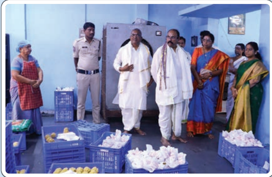
(మొదటి పేజీ తరువాయి...)

అలయ అర్చకులు ప్రత్యేక పూజలు నిర్వహించి శేషవస్త్రాలు, తీర్థప్రసాదాలు అందజేశారు. అనంతరం ఆలయంలోని ఉప ఆలయాల్లోని లక్ష్మీతాయారు. అభయాంజనేయస్వామి ఆలయాల్లో ప్రత్యేక పూజలు నిర్వహించారు. ఈ సందర్భంగా అర్చకులు ఆయనకు ఆలయ విశిష్టతను వివరించారు.