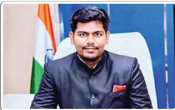
భద్రాచలం, డిసెంబర్ 8 ప్రజాజ్యోతి:

భద్రాచలం ఐటీడీఏ కార్యాలయంలో సోమవారం గిరిజన దర్బార్ నిర్వహిస్తున్నట్లు భద్రాచలం ఐటీడీఏ పీఠోపాధ్యక్షుల ఆదివారం తెలిపారు. ఈ గిరిజన దర్బార్ 10.30 గంటలకు ఐటీడీఏ సమావేశ మందిరంలో జరుగుతుందని, అన్ని శాఖల ఐటీడీఏ యూనిట్ అధికారులు సకాలంలో హాజరుకావాలని తెలిపారు. గిరిజనులు వారి సమస్యలకు సంబంధించి అంశాలపై లిఖితపూర్వకంగా ఫిర్యాదులు అందజేయాలని తెలిపారు.