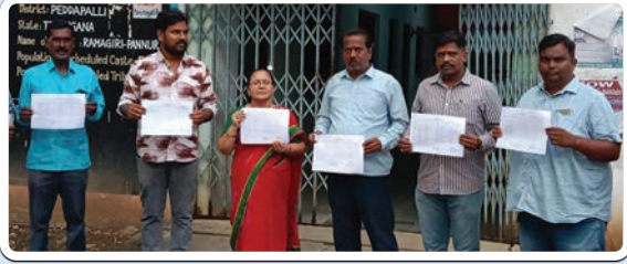
రామగిరి, డిసెంబర్ 07 (ప్రజాజ్యోతి):