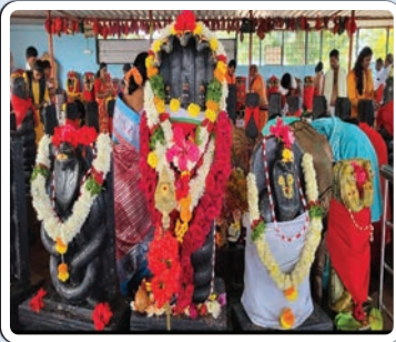
చిగురుమామిడి డిసెంబర్ 07 (ప్రజాజ్యోతి)