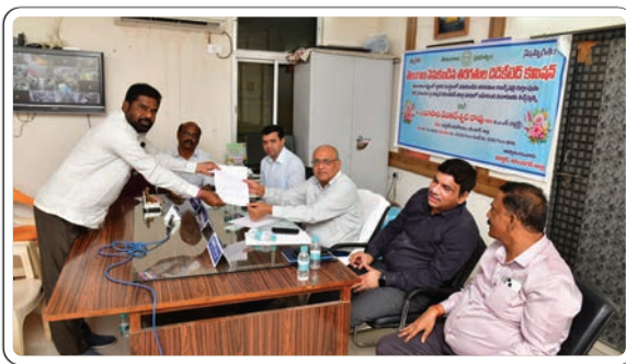
డితో అందజేయాలని కోరడం జరిగింది. అలాగే రాజస్థాన్ గుజరాత్ రాష్ట్రాలలో కుమ్మర వృత్తి ఆధునికీకరించినందున అలాంటి యంత్రాలను తెలంగాణ రాష్ట్రంలో కూడా ప్రవేశ పెట్టి కుమ్మర వృత్తిని ప్రభుత్వాన్ని పెంచేందుకు కుమ్మర వృత్తిదారులను రాష్ట్ర ప్రభుత్వం ప్రోత్సహించాలని తెలంగాణ వెనుకబడిన తరగతుల డెడికేటేడ్ కమిషన్ బృందాన్ని కోరడం జరిగింది. తెలిపారు