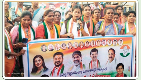
కొత్తగూడెం, డిసెంబర్ 6 (ప్రజాజ్యోతి):