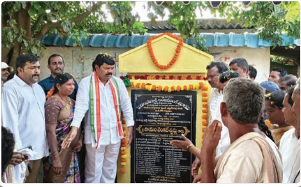
(మొదటి పేజీ తరువాయి...)

రైతులకు బోనస్ వెంటనే ఇస్తున్నామని అన్నారు ఉచిత కరెంటును అందించడమే కాక ఇందిరమ్మ ఇళ్ల నిర్మాణానికి ముఖ్యమంత్రి యాభ్యుప్రారంభించడం జరిగిందన్నారితని నియోజకవర్గంలో నిరుపేదలకు 3500 మొదటి విడతగా అందిస్తామని గిరిజన ప్రాంతమై నందున ఐటీడిపి పరిధిలో అదనంగా 15000 లైన్ నిర్మాణం చేపట్టబోతున్నట్లు అయిన ప్రకటించారు గత ప్రభుత్వం అప్పులను అంటగట్టితే అప్పులను కట్టుకుంటూ అభివృద్ధి సంక్షేమాన్ని ప్రజలకు అందిస్తూ ప్రజల మధ్యలో ప్రజా