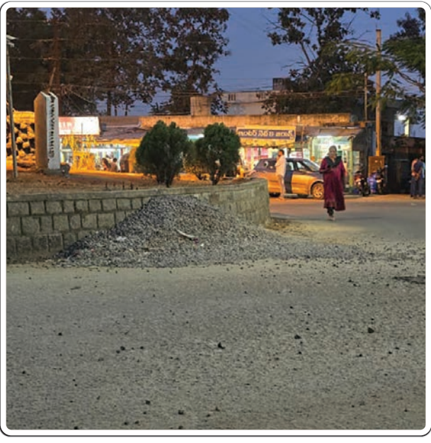
సింగరేణి అధికారులు స్పందించి రోడ్డుపై ఉన్న ఆకంకరను తొలగించాలంటే ప్రమాదం జరగక ముందే లని ప్రజలు కోరుతున్నారు.

చేసుకోని సుమారుగా 10 రోజులు కావ స్తున్న ఆ కాంట్రాక్టర్ రోడ్డుపై ఉన్న కంకరను ఇంకా తొలగించకపోవడం ప్రజలకు శాపంగా మారిందనే చెప్పొచ్చు. దీంతో వాహనదారులు ముఖ్యంగా ద్వీచక్ర వాహనదారులు అనేక ఇబ్బందులు పడుతున్నారు. ఒకవేళ భారీ వాహన ట్రైలర్ క్రింద ఆకంకర రాయి పడి ఎగిరి ఎవరి మీద పడిన వారి ప్రాణాలకు రక్షణ లేదనేది వాస్తవం. ఒకవేళ ఏదైనా ప్రమాదం జరిగితే ఎవరు బాధ్యత వహిస్తారో అర్థం కానీ పరిస్థితి. ఇప్పటికైనా