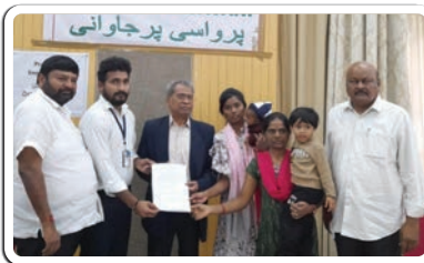
జగిత్యాల బ్యారో, డిసెంబర్ 03 ప్రజాజ్యోతి: