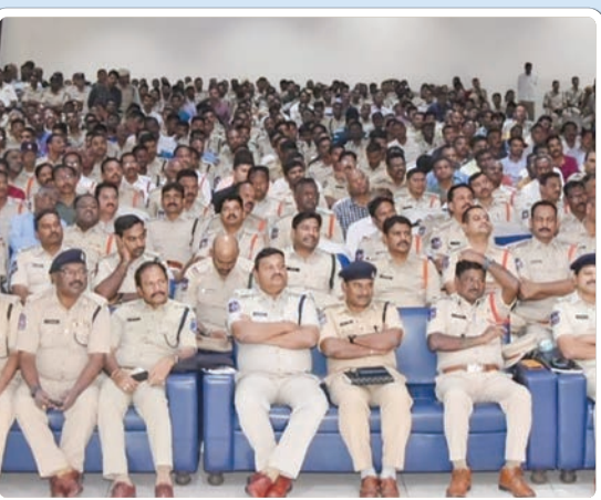
(మొదటి పేజీ తరువాయి...)