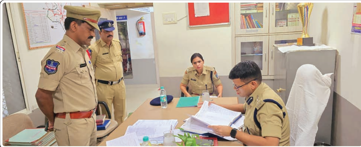
(మొదటి పేజీ తరువాయి...)

పోలీస్ సిబ్బందితో మాట్లాడారు. వారికి కేటాయించబడిన విధులు అడిగి తెలుసుకున్నారు. సరైన పద్ధతిలో రికార్డుల నిర్వహణ, నమోదైన కేసుల వివరాలు సిసిటిఎన్ఎస్ లో పొందుపరచాలన్నారు. పెండింగ్ కేసులపై సమీక్ష చేశారు. వాటికి గల కారణాలు తెలుసుకున్నారు. త్వరితగతిన వాటిని పూర్తి చేయాలని సూచించారు. నమోదైన సైబర్ నేరాల గురించి తెలుసుకున్నారు. విసిబుల్ పోలీసింగ్ పై ప్రత్యేక దృష్టి పెట్టాలన్నారు. గ్రామాల వారిగా పోలీసు స్టేషన్ పరిధిలోని అన్ని గ్రామాలకు పోలీసు అధికారులను కేటాయించాలని ఆదేశించారు... నూతనంగా విధుల్లో చేరిన కానిస్టేబుళ్లకు పలు సూచనలు చేశారు. పోలీసు స్టేషన్ లో అన్ని రకాల విధులను సక్రమంగా నేర్చుకోవాలన్నారు. రికార్డ్ నిర్వహణ, సీసీటిఎన్ఎస్, రిసెప్షన్, కోర్టు డ్యూటీ, డ్రంక్ అండ్ డ్రైవ్ తనిఖీలు, బీట్, పెట్రోలింగ్, సమన్లు మొదలగు విధులను సీనియర్ ద్వారా తెలుసుకోవాలన్నారు. నిజా