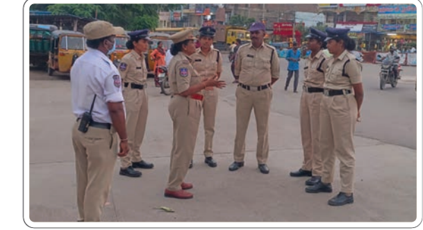
హుజూరాబాద్, డిసెంబర్ 3, ప్రజాజ్యోతి: