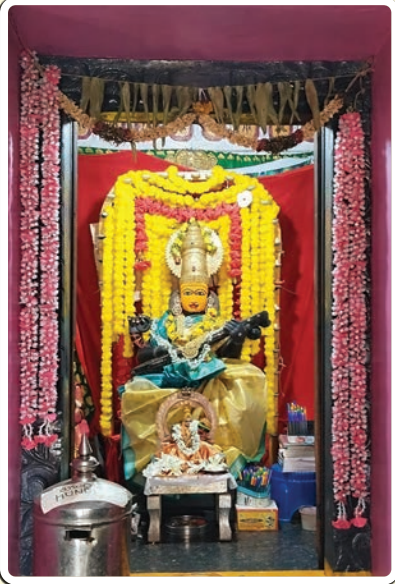
జగిత్యాల టౌన్ డిసెంబర్ 03 ప్రజాజ్యోతి

జగిత్యాల జిల్లాలోని నూకపెల్లి గ్రామం అర్బన్ కాలనీలో గల శ్రీ సరస్వతి దేవి ఆలయంలో అమ్మవారి జన్మనక్షత్రం అయిన మూల నక్షత్రం సందర్భంగా ఘనంగా పూజలు నిర్వహించారు తదుపరి భక్తులచే హోమం నిర్వహించారు పూజలు అనంతరం ఏర్పడిన భక్తులకు తీర్థ ప్రసాదాలతో పాటు ఏర్పడిన టుంబి భక్తులకు అన్నదానం కూడా నిర్వహించారు ఇట్టి కార్యక్రమంలో ఆలయ అర్చకులతో పాటు సరస్వతిమాత ఆలయ కమిటీ సభ్యులు, భక్తులు భారీగా పాల్గొని కార్యక్రమం లని విజయవంతం చేశారు.