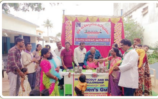
బేకులపల్లి, డిసెంబర్ 03, ప్రజాజ్యోతి:

దివ్యాంగుల పిల్లలు సాధారణ పిల్లలతో పాటు సమానంగా రాణించాలి.