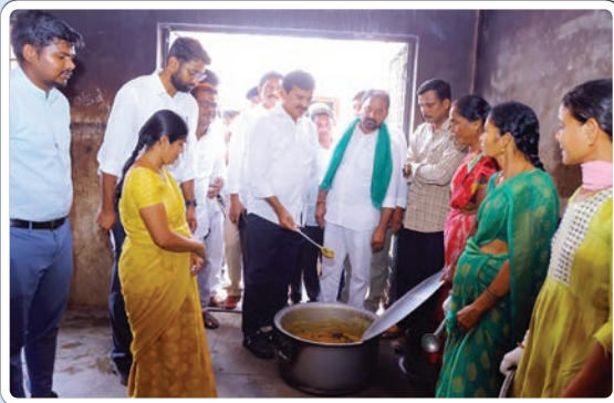
జూలూరుపాడు, డిసెంబర్ 3 (ప్రజాజ్యోతి):