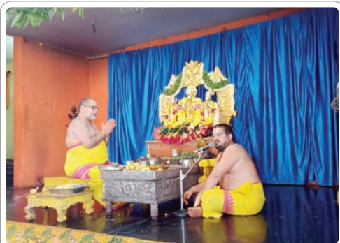
భద్రాచలం, డిసెంబర్ 03, ప్రజాజ్యోతి:

భద్రాచలం శ్రీసీతారామచంద్రస్వామి ఆలయంలో మంగళవారం అంతరాలయంలో మూలవరులకు అర్చకులు అర్చన జరిపారు. అంతరాలయంలోని ధ్వజస్తంభాలకు ప్రత్యేక అభిషేకం నిర్వహించారు. ఈ అభిషేకంలో పాల్గొన్న భక్తులు మురిసిపోయారు. అర్చకులు తెల్లవారజామున ఆలయ తలుపులు తెరిచి స్వామివారికి సుప్రభాతం పలికి ఆరాధన, ఆరగింపు, సేవాకాలం, నిత్యహోమాలు, నిత్యపూజలు భక్తిశ్రద్ధలతో జరిపారు. అనంతరం స్వామివారి నిత్యకల్యాణమూర్తులను ప్రాకార మండపానికి తీసుకువచ్చి శాస్త్రోక్తంగా నిత్యకల్యాణం నిర్వహించారు. కల్యాణంలో పాల్గొన్న జంటలకు స్వామివారి ప్రసాదాలు, శేషస్నానం అందజేశారు.