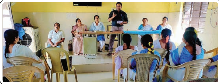
బేకులపల్లి, డిసెంబర్ 03, ప్రజాజ్యోతి: