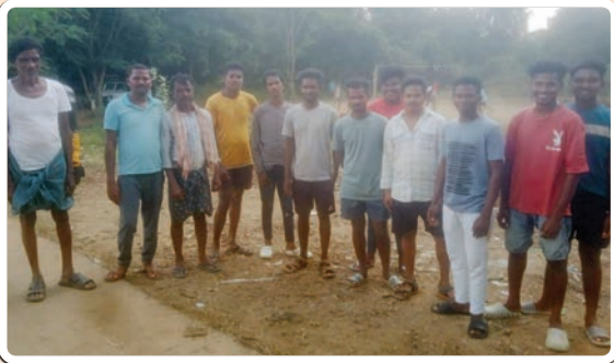
ములకలపల్లి, డిసెంబర్ 03, ప్రజాజ్యోతి: