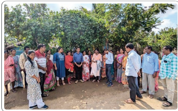
ఏజెన్సీ ప్రాంతాల్లో పర్యటన, పలు అంశాలు పరిశీలన