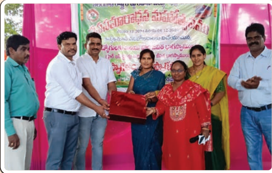
భద్రాచలం టౌన్, డిసెంబర్ 3, ప్రజాజ్యోతి