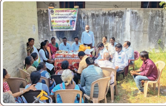
భద్రాచలం టౌన్, డిసెంబర్ 3 (ప్రజాజ్యోతి)