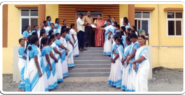
ములకలపల్లి, డిసెంబర్ 03, ప్రజాజ్యోతి: