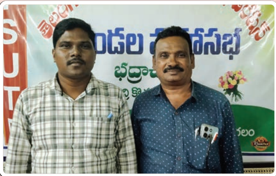
భద్రాచలం టౌన్ డిసెంబర్ 3 (ప్రజాజ్యోతి)