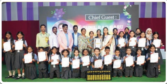
సుల్తానాబాద్, డిసెంబర్ 30 (ప్రజాజ్యోతి):

కరీంనగర్ లో విశ్వం ఎడ్యుటేక్, గామా అధ్యక్షులలో ఆదివారం నిర్వహించిన అబాకస్ వేదిక గణిత జిల్లా స్థాయి పోటీల్లో సుల్తానాబాద్ పట్టణంలోని ఇండియన్ పబ్లిక్ పాఠశాల విద్యార్థులు పాల్గొని ఉత్తమ ప్రతిభ కనబరిచి మొదటి బహుమతులు సాధించారు.