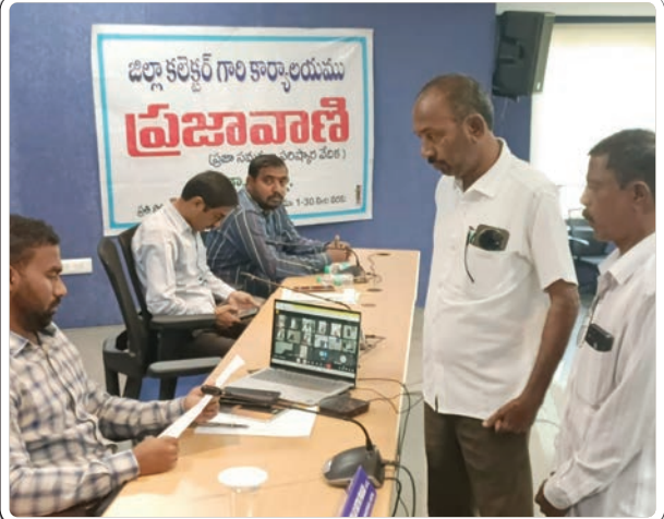
జగిత్యాల జ్యూర్, డిసెంబర్ 30, ప్రజాజ్యోతి: