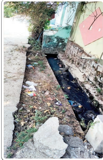
-మాటలు తప్ప..చేతులు లేవు!

కోరుట్ల పట్టణంలో ప్రజాప్రతినిధులు, అధికారుల మాటలు కోటలు దాటినా.. చేతలు గడపలు దాటడం లేదు. ప్రతిరోజు అధికారుల పర్యటనలు తప్ప ఫలితాలు కనపడడం లేదు. మరోవైపు ఇంటింటికి, గడప గడపకు అంటూ సమస్యలు తెలుసు కుంటున్నామనిటూ ప్రజా ప్రతినిధులు కాళ్ళరిగేలా తిరగడం తప్ప క్షేత్రస్థాయిలో ఆశించిన ప్రయోజనాలు కనిపించడం లేదు. ముఖ్యంగా పట్టణంలో పలు వార్డుల్లో ఈస్థితులు కనిపిస్తున్నాయి. మురుగు కాలువలు, దోమల ఉత్పత్తి కేంద్రాలుగా మారి ఉన్నాయి. సమీప గృహాల ప్రజలు నిద్రలేని రాత్రులు గడుపుతున్నారు. మురుగును కాలువలు పూడికలు తీసి ఎన్నేళ్లయిందో అర్థం కావడం లేదు. కాలువల్లో ప్లాస్టిక్ చెత్త పరుచుకుపోయి మురుగును ముందుకు కదలనివ్వడం లేదు. వరుసగా పట్టణంలోని పలు వార్డుల్లో, మున్సిపల్ సమీపంలో, టీచర్స్ క్లబ్, భీముని దుబ్బా లోని ఆర్టిస్టి డిపో వెనుక మురుగు కాలువలు ఏళ్ల తరబడిగా పూడికలకు నోచుకోక పూడిపోయి ఉన్నాయి. ప్లాస్టిక్ చెత్త పరుచుకుని మురుగు ముందుకు కదలక అవ్వకుండా పడుతూ కాలువలు కంపు కొడుతున్నాయి. ఈ గలు, దోమలు జుమ్మని ముసురుకుంటున్నాయి. పలు వార్డుల్లో కూడా ఇదే దుస్థితి. ఒకటిన్నర అడుగు వెడల్పు గల మురుగు కాలువలు అయితే పారిశుధ్య సిబ్బంది శుభ్రం చేయాలి ఉంది. మున్సిపల్ పారిశుధ్య కార్మికులు అధికారులకు తెలిపి ఈ కాలువలను పూడికలు తీయించాలి ఉంది. ఓ వైపు మున్సిపల్ కమిషనర్ అనేక ప్రాంతాల్లో ప్రతినిత్యం మార్నింగ్ విజిటింగ్ చేస్తూ మురుగు కాలువలు దుస్థితి స్వయంగా పర్యవేక్షించాలి. కాని సంబంధిత కమిషనర్, ఇంజనీరింగ్, డి.ఈ.లకు, ఇంజనీరింగ్ విభాగ అధికారులు ఈ విషయం పట్టినట్లు లేదు. అసలు ఈ కాలువలను వారు ఏనాడు కన్నెత్తి చూసిన పాపాన పోలేదు..