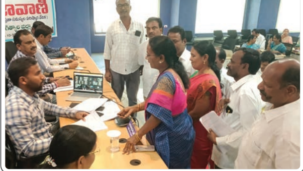
జగిత్యాల రూరల్, డిసెంబర్ 30, ప్రజాజ్యోతి:

ప్రజావాణిలో బతికేపల్లి మండల సాధన సమితి సభ్యుల వినతి