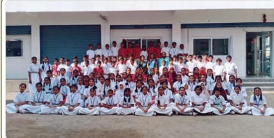
జగిత్యాల టౌన్ డిసెంబర్ 30 ప్రజాజ్యోతి: