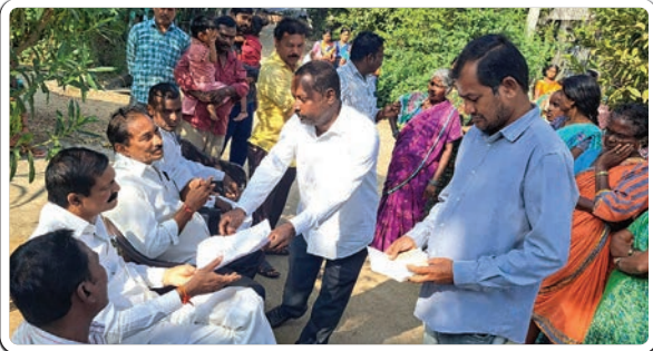
కోరుట్ల డిసెంబర్ 29 ప్రజాజ్యోతి