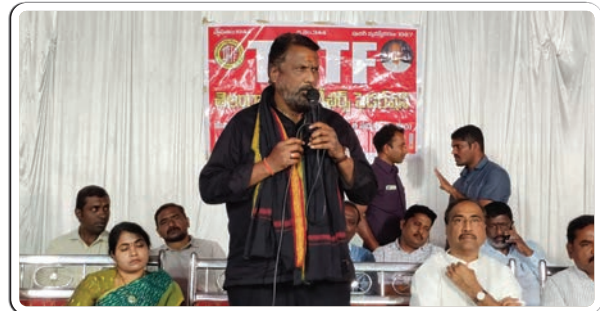
జగిత్యాల, డిసెంబర్ 29, ప్రజాజ్యోతి:

2025 సంవత్సరం గాను నూతన క్యాలెండర్ ఆవిష్కరణ కార్యక్రమం ఎం ల్ ఎ క్యాంప్ ఆఫీస్ నందు నిర్వహించడం జరిగింది ఇట్టి కార్యక్రమంలో తెలంగాణ ప్రాంత ఉపాధ్యాయ సంఘం బాధ్యులు ఉపాధ్యాయ విద్యారంగ సమస్యలను ఎం ల్ ఎ దృష్టికి తీసుకు వెళ్ళినప్పుడు