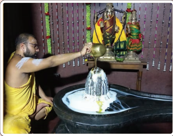
కరీంనగర్ రూరల్, డిసెంబర్ 28, ప్రజాజ్యోతి