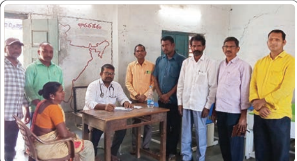
కోరుట్ల డిసెంబర్ 29 ప్రజాజ్యోతి