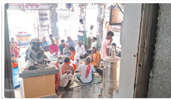
ప్రజాజ్యోతి: జగిత్యాల డిసెంబర్ 29

రాయకల్ మండలం, అల్లిపూర్ గ్రామం వేకువ జామునే లేచి స్నానం చేసి పట్టు వస్త్రాలు ధరించి అల్లిపూర్ లో కొలువైన రాజరాజేశ్వర స్వామి సన్నిధిలో భక్తులు కూర్చోని మనసుతో రెండు చేతులు జోడించి శివ శివ శివ శివ అని స్మరించు కుంటూ ఈ సంవత్సరమైనా కష్టాలనుండి కాపాడవయ్యా అని శివయ్యను వేడు కుంటున్నారు. విశేషమైన పూజలు చేసి మహా రుద్రాభిషేకం చేసి తదనంతరం హనుమాన్ భజన మండలి అధ్యక్షంలో భక్తులు భజన కార్యక్రమంలో పాల్గొన్నారు. తరువాత తీర్ధ ప్రసాదాలు తీసుకున్నారు. ఈ కార్యక్రమంలో రాజ రాజేశ్వర స్వామి ఆలయ ఫౌండర్ చైర్మన్, ఆలయ అర్చకులు, భజన మండలి సభ్యులు, భక్తులు అధిక సంఖ్యలో పాల్గొన్నారు.