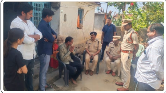
కోరుట్ల డిసెంబర్ 29, ప్రజాజ్యోతి