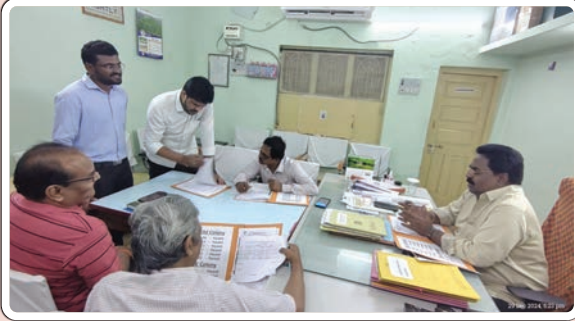
ఇల్లందు, డిసెంబర్ 29, ప్రజాజ్యోతి: