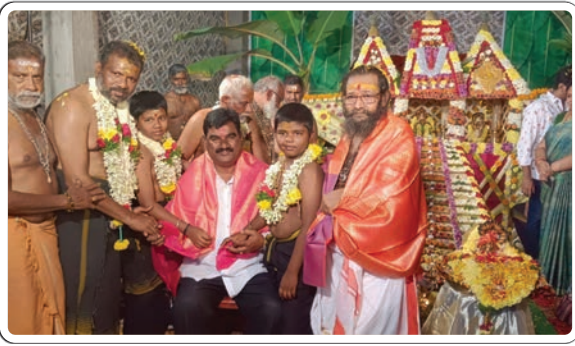
పాల్వంచ, డిసెంబర్ 29 (ప్రజాజ్యోతి):