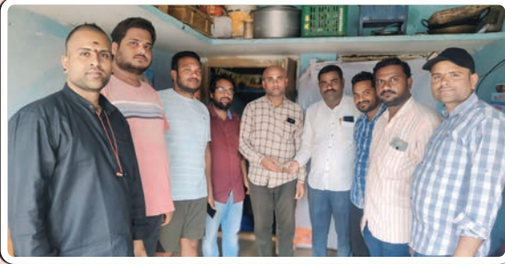
చొప్పదండి, డిసెంబర్ 1 (ప్రజాజ్యోతి):