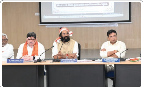
(మొదటి పేజీ తరువాయి...)