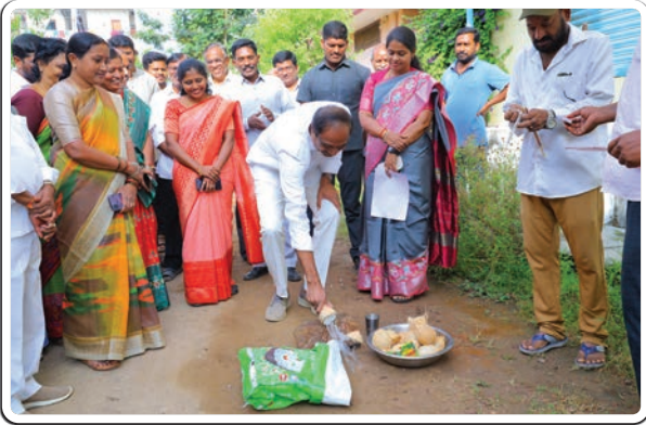
జగిత్యాల బ్యారో డిసెంబర్ 01 ప్రజాజ్యోతి: