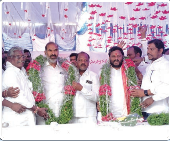
(మొదటి పేజీ తరువాయి...)