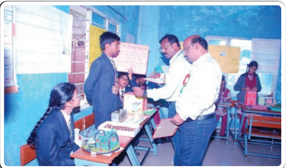
కరీంనగర్ రూరల్, డిసెంబర్ 1, (ప్రజాజ్యోతి)