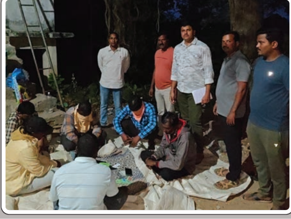
మలాపూర్ డిసెంబర్ 01, ప్రజాజ్యోతి: