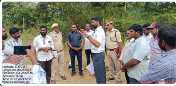
Latitude: 17.677187 Longitude: 80.657572 Elevation: 154.26x25 m Accuracy: 4.1 m Time: 01-12-2024 12:16 Note: kinnersaani.gp