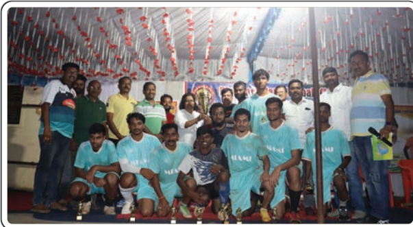
భద్రాచలం టౌన్, డిసెంబర్ 1 (ప్రజాజ్యోతి)