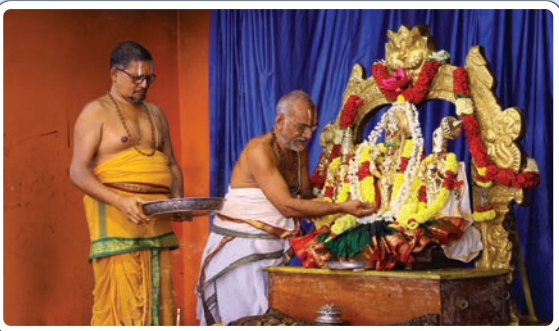
భద్రాచలం టౌన్, డిసెంబర్ 1 (ప్రజాజ్యోతి)

భద్రాచలం శ్రీ సీతారామచంద్రస్వామివారి దేవస్థానంలో ఆదివారం స్వామి వారికి అర్చకులు సువర్ణ పుష్పార్చన నిర్వహించారు. ఉదయం 4 గంటలకే అర్చకులు ఆలయ తలుపులు తెరిచి స్వామివారికి సుప్రభాత సేవ నిర్వహించారు. అనంతరం ఆరాధన, సేవాకాలం, నిత్య బలిహారణం, పవిత్ర గోదావరి జలంతో అభిషేకం తదితర నిత్య పూజా కార్యక్రమాలు యథావిధిగా జరిపారు. అనంతరం రామయ్య నిత్యకల్యాణాన్ని వైభవంగా నిర్వహించారు. భద్రాచలం రామాలయంలో ఆదివారం సెలవు దినం కావడంతో భక్తుల తాకిడి పెరిగింది. ఖమ్మం, భద్రాద్రి జిల్లా నుంచి కాకుండా పలు జిల్లాలు, రాష్ట్రాల నుంచి భక్తులు ఉదయాన్నే రామాలయానికి చేరుకున్నారు. ముందుగా పవిత్ర గోదావరిలో భక్తులు స్నానాలను ఆచరించి మొక్కులు చెల్లించారు. తదనంతరం స్వామివారిని దర్శించుకుని తీర్థప్రసాదాలను స్వీకరించారు.