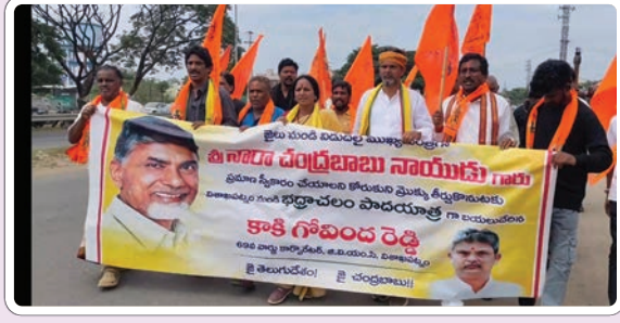
భద్రాచలం, డిసెంబర్ 1 (ప్రజాజ్యోతి):