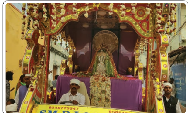
ఇల్లందు, డిసెంబర్ 1, ప్రజాజ్యోతి:

ఉర్సు మహోత్సవంలో ఇల్లందు ప్రాంత మంతా ఆధ్యాత్మికతో పరవశించిపోయింది. వేలాదిగా ఉర్సు మహోత్సవంలో పాల్గొనేందుకు వచ్చిన భక్తజనంతో పట్టణంలోని పురవీధులన్నీ కిక్కిరిసిపోయాయి. 22 ఏళ్లుగా ఇల్లందులో జరుగుతున్న ఉర్సు వేడుకల్లో కుల మతాలకు అతీతంగా వేలాదిగా భక్తులు తరలివచ్చారు. శాంతికి ప్రతిరూపంగా భక్తజనం అంతా తెల్లని వస్త్రాలు ధరించి ఎంతో క్రమశిక్షణతో పట్టణంలోని హుసేన్-హుసేన్ నాల్ హైదర్ నుంచి సత్యనారాయణ పురంలోని దర్గాకు పవిత్ర సందళ్, నిషానీలను బగ్గలతో ఎంతో క్రమశిక్షణతో ఊరేగింపుగా తీసుకువచ్చి సమర్పించారు. సందర్ ఊరేగింపులో భాగంగా భక్తజనం అంతా ఎంతో భక్తిరధలతో