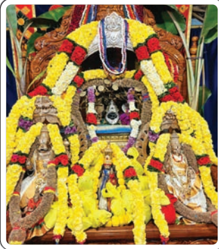
భద్రాచలం టౌన్, డిసెంబర్ 1 (ప్రజాజ్యోతి)