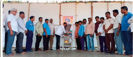
కొత్తగూడెం సింగరేణి / డిసెంబర్ 27 (ప్రజాజ్యోతి):