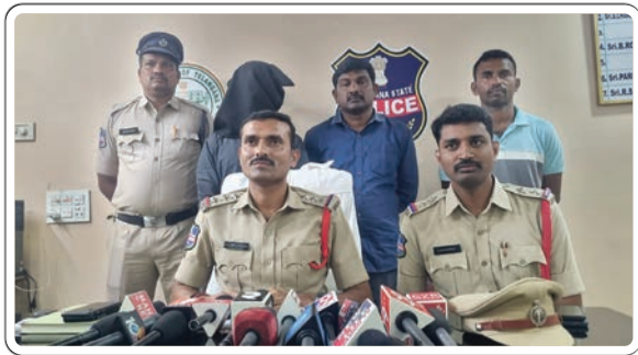
అశ్వారావుపేట, డిసెంబర్ 25, ప్రజాజ్యోతి:

పలుప్రాంతాల్లో ద్వీచక్ర వాహనాలను చోరీ చేస్తున్న నేరస్తుడిని పోలీసులు చాకచక్యంగా అదుపులోకి తీసుకున్నారు. అతని వద్ద 9 ద్వీచక్ర వాహనాలను స్వాధీనం చేసుకున్నారు. బుధవారం అశ్వారావుపేట సర్కిల్ ఇన్స్పెక్టర్ సీఐ కరుణాకర్ తమ కార్యాలయంలో