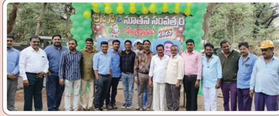
ఇల్లందు, డిసెంబర్ 25, ప్రజాజ్యోతి: