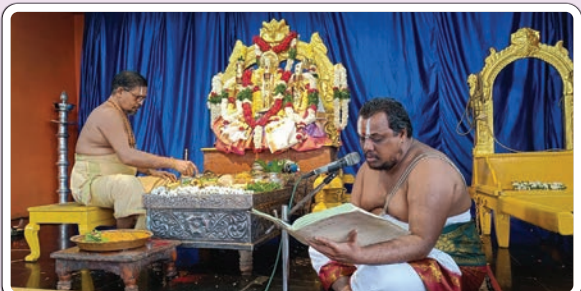
భద్రాచలం, డిసెంబర్ 25 (ప్రజాజ్యోతి):

భద్రాచలంలోని శ్రీసీతారామచంద్రస్వామి ఆలయంలో సీతారాముల నిత్యకల్యాణం బుధవారం వైభవంగా నిర్వహించారు. తెల్లవారుజామున ఆలయ తలుపులు తెరిచి స్వామివారికి సుప్రభాతం పలికి, ఆరాధన, అరగింపు, సేవాకాలం, నిత్యహోమాలు, నిత్యబలిహారణం తదితర పూజలను భక్తిశ్రద్ధలతో నిర్వహించారు. నిత్యకల్యాణంలో పాల్గొన్న దంపతులకు లకు స్వామివారి ప్రసాదాలు, శేషపస్తాలు అందజేశారు. వైభవంగా సుదర్శన హోమం... భద్రాచలం శ్రీసీతారామచంద్రస్వామి దేవస్థానంలోని చిత్రకూట మండపంలో స్వామివారి ఉత్సవమూర్తులకు సుదర్శనహోమం వైభవంగా నిర్వహించారు. శాస్త్రోక్తంగా అర్చకులు స్వామివారికి హోమం నిర్వహించి ప్రత్యేక పూజలు నిర్వహించారు ఈ కార్యక్రమానికి భక్తులు పెద్ద ఎత్తున పాల్గొన్నారు.