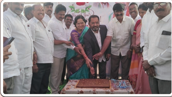
ఇల్లందు, డిసెంబర్ 25, ప్రజాజ్యోతి: