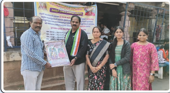
ధర్మపురి (డిసెంబర్ 24) ప్రజాజ్యోతి: