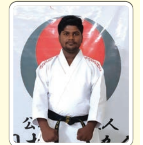
మెట్ పల్లి, డిసెంబర్ 24, ప్రజాజ్యోతి: