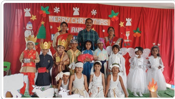
పాటలు, నృత్య ప్రదర్శనలతో అలరించారు. ఈ కార్యక్రమంలో విద్యార్థులు అధ్యయన బృందం తదితరులు పాల్గొన్నారు.