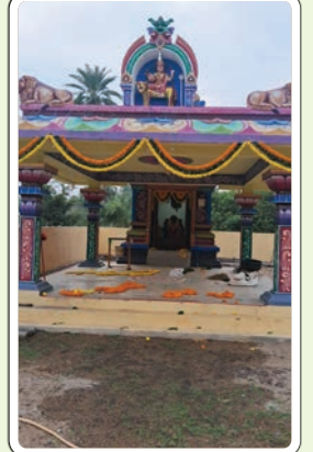
చొప్పదండి, డిసెంబర్ 24 (ప్రజాజ్యోతి):

చొప్పదండి దుర్గామాత ఆలయ ప్రథమ వార్షికోత్సవం బుధవారం నిర్వహిస్తున్నట్లు సమ్మక్క సారలమ్మ ఉత్సవ కమిటీ ఒక ప్రకటనలో తెలిపింది. గుడి నిర్మాణానికి సహకరించిన దాతలు, ప్రజా ప్రతినిధులు, ప్రభుత్వ ఉద్యోగులు, అన్ని కుల సంఘాలు అమ్మవారిని దర్శించుకొని కృపకు పాత్రులు కావాలని కమిటీ కోరింది.