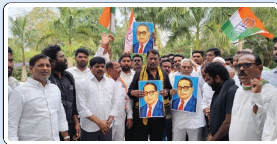
జగిత్యాల అర్చన్, డిసెంబర్ 24, ప్రజాజ్యోతి