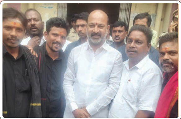
జమ్మికుంట, డిసెంబర్ 24, ప్రజాజ్యోతి:

శబరి యాత్రకోసం కేంద్ర మంత్రి బండి సంజయ్ కి వినతి