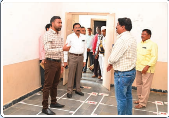
జగిత్యాల బ్యారో డిసెంబర్ 24 ప్రజాజ్యోతి: