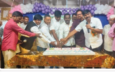
జమ్మికుంట, డిసెంబర్ 24, ప్రజాజ్యోతి:

జమ్మికుంట పట్టణంలోని వినాయక గార్డెన్ లో మంగళవారం జమ్మికుంట, వీణవంక మండలాల క్రైస్తవ కుటుంబ