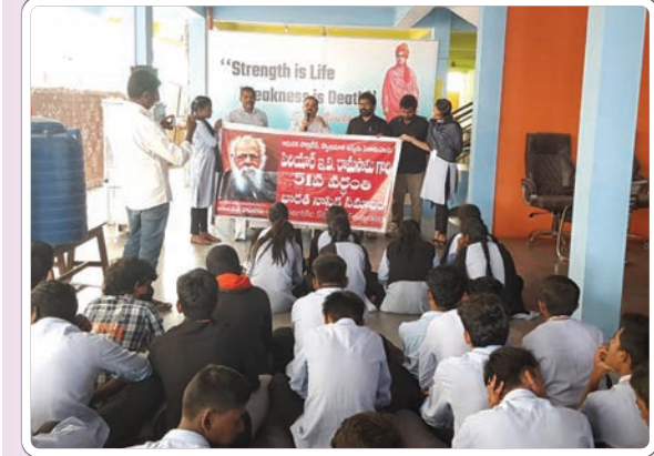
జమ్మికుంట, డిసెంబర్ 24, ప్రజాజ్యోతి: