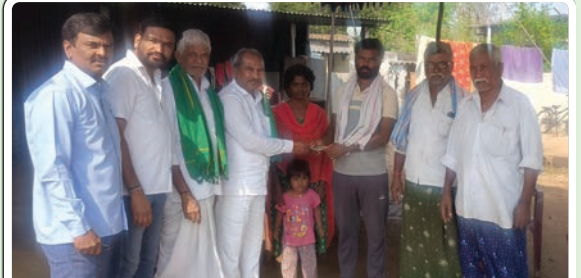
చొప్పదండి, డిసెంబర్ 22 (ప్రజాజ్యోతి):