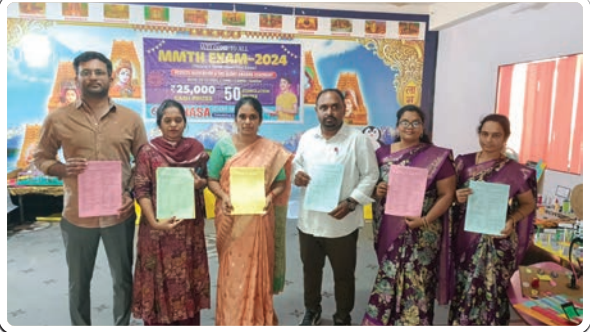
జిల్లా టౌన్ డిసెంబర్ 22 ప్రజాజ్యోతి:

జిల్లా పట్టణంలోని జ్యోతి హై స్కూల్ ఐఐటి అకాడమీలో గణిత శాస్త్రవేత్త శ్రీనివాస రామానుజన్ జన్మదినాన్ని పురస్కరించుకొని ఆదివారం జాతీయ గణిత దినోత్సవ వేడుకలు ఘనంగా నిర్వహించారు. విద్యార్థుల్లో దాగి ఉన్న ప్రతిభను వెలికితీ