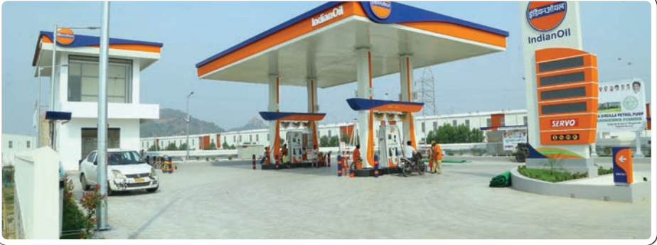
సిరిసిల్ల, డిసెంబరు 22 (ప్రజాజ్యోతి)