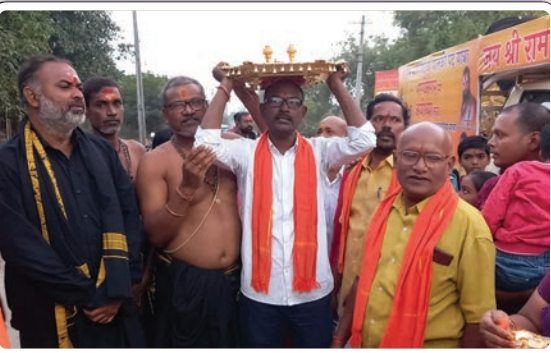
జగిత్యాల, టౌన్ డిసెంబర్ 22 ప్రజాజ్యోతి: