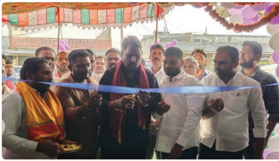
ధర్మపురి (డిసెంబర్ 22, 24) ప్రజాజ్యోతి: