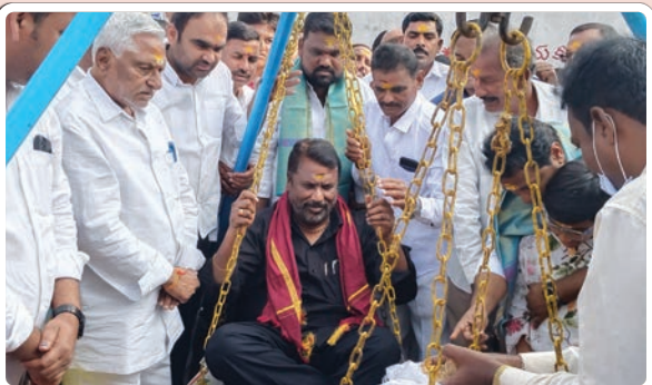
జిల్లా రూరల్, డిసెంబర్ 22, ప్రజాజ్యోతి: