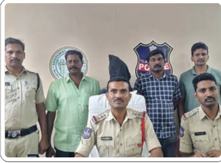
అశ్వారావుపేట, డిసెంబర్ 21, ప్రజాజ్యోతి: