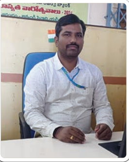
బేకులపల్లి, డిసెంబర్ 21, ప్రజాజ్యోతి: