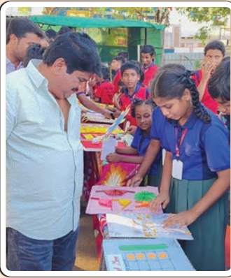
బూర్గంపహాడ్, డిసెంబర్ 21 (ప్రజాజ్యోతి):