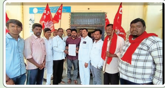
జూలూరుపాడు, డిసెంబర్ 21 (ప్రజాజ్యోతి)