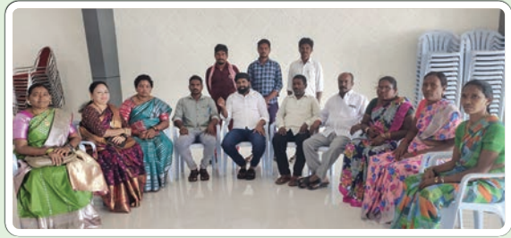
జూలూరుపాడు, డిసెంబర్ 21 (ప్రజాజ్యోతి)

విశ్వహిందూ మహాసంఘం తెలంగాణ అధ్యక్షులు మద్దిశెట్టి