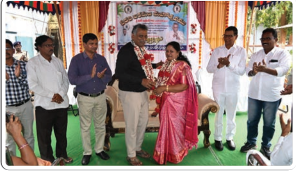
ఇల్లందు / నవంబర్ 30 (ప్రజాజ్యోతి):