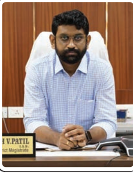
కొత్తగూడెం కలెక్టరేట్ / నవంబర్ 30 (ప్రజాజ్యోతి):