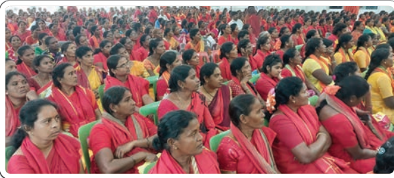
చంద్రగోండ / నవంబర్ 30 (ప్రజాజ్యోతి):