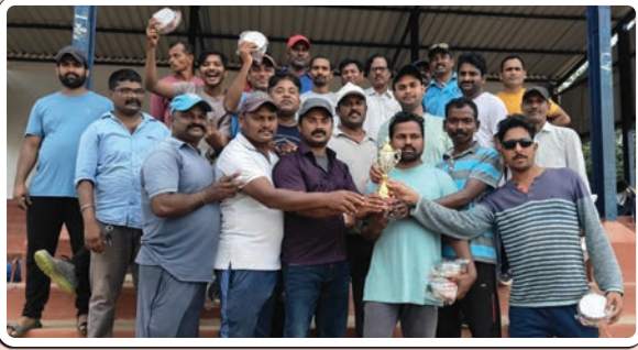
ఇల్లందు / నవంబర్ 30 (ప్రజాజ్యోతి):