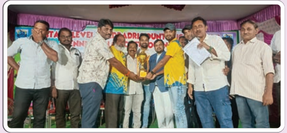
భద్రాచలం టౌన్, డిసెంబర్ 18 (ప్రజాజ్యోతి)