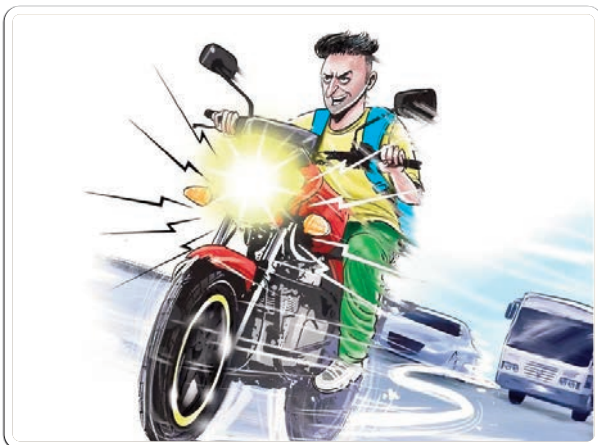
వేగంగా వెళుతున్నారు. దీంతో ఫ్యామిలీతో చిన్నపిల్లలని బైకు ల పై ప్రయాణి

కొత్తగూడెం లో మైనర్ ర్యాష్ డ్రైవింగ్ వాహనదారులతో పాటు నడుచు కుంటూ వెళుతున్న వారిని అదలెత్తిస్తూ భయాందోళనకు గురి చేస్తున్నారు. మైనర్ అతివేగంగా డ్రైవ్ చేస్తుండటంతో పాటు సైలెన్సర్లు రేస్ చేస్తు