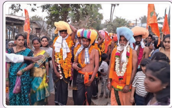
అశ్వపల్లి, డిసెంబర్ 18 ప్రజాజ్యోతి