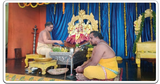
భద్రాచలం, డిసెంబర్ 18 (ప్రజాజ్యోతి):

భద్రాచలంలోని శ్రీసీతారామచంద్రస్వామి ఆలయంలో సీతారాముల నిత్యకల్యాణం బుధవారం వైభవంగా నిర్వహించారు. తెల్లవారుజామున ఆలయ తలుపులు తెరిచి స్వామివారికి సుప్రభాతం పలికి, ఆరాధన, ఆరగింపు, సేవాకాలం, నిత్య హోమాలు, నిత్యబలిహారణం తదితర పూజలను భక్తి శ్రద్ధలతో నిర్వహించారు. నిత్య కల్యాణంలో పాల్గొన్న జంటలకు స్వామివారి ప్రసాదాలు, శేషవస్త్రాలు అందజేశారు.