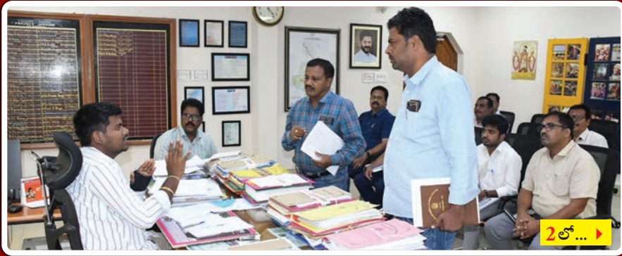
2 లో... >