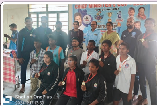
చొప్పదండి, డిసెంబర్ 17 (ప్రజాజ్యోతి):