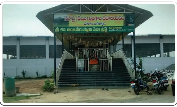
జగిత్యాల రూరల్ డిసెంబర్ 17 ప్రజాజ్యోతి: