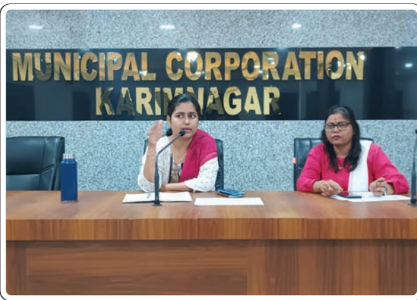
కరీంనగర్ బ్యూరో, డిసెంబర్ 17, ప్రజాజ్యోతి

రాష్ట్ర ప్రభుత్వం ప్రతిష్టాత్మకంగా చేపట్టిన ఇందిరమ్మ నివాస గృహాల పథకం సర్వేను వేగవంతంగా పూర్తి చేయాలని అధికారులు, సిబ్బందిని ఆదేశించారు. కరీంనగర్ నగరపాలక సంస్థ సమావేశ మందిరంలో మంగళవారం రోజు నగరపాలక సంస్థ బిల్లు కలెక్టర్లు, ఈ రోజు, ఆర్ ఐ లు, వివిధ సెక్షన్ల క్లర్కులతో కమీషనర్ చాహాత్ బాజ్ పాయ్ సమీక్ష సమావేశం నిర్వహించారు. ఈ సమావేశం లో ఇందిరమ్మ ఇండ్ల లబ్ధిదారుల సర్వే, ఆస్తి పన్నుల వసూలు అంశాల పై అధికారులు సిబ్బందితో