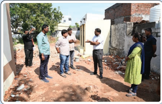
(మొదటి పేజీ తరువాయి...)