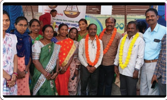
జగిత్యాల టౌన్ డిసెంబర్ 17 ప్రజాజ్యోతి: