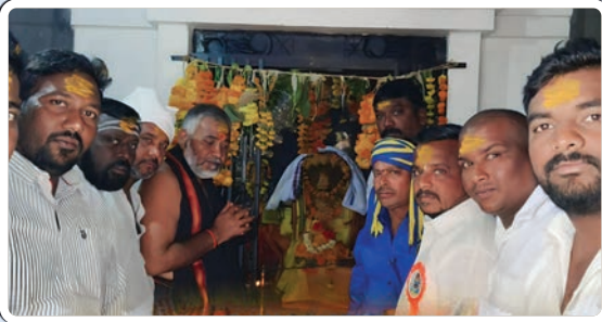
ప్రజాజ్యోతి: జగిత్యాల, డిసెంబర్ 17