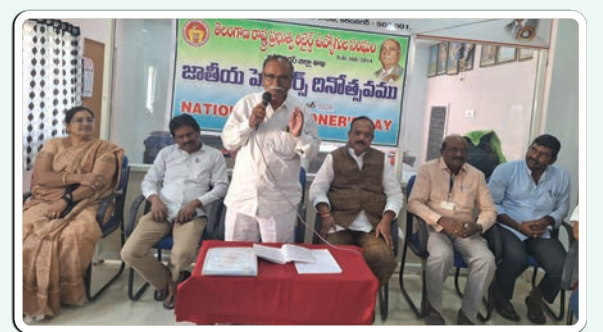
కరీంనగర్ బ్యూరో, డిసెంబర్ 17, (ప్రజాజ్యోతి)