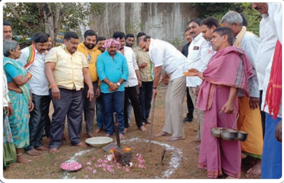
కరీంనగర్ టౌన్, డిసెంబర్ 17, ప్రజాజ్యోతి