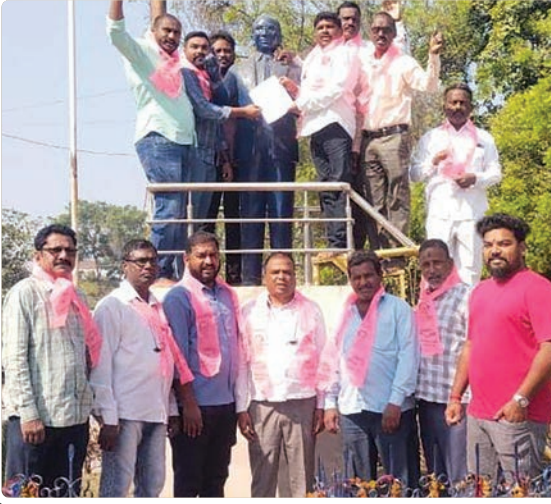
కొడిమ్యాల, డిసెంబర్ 17, (ప్రజాజ్యోతి):