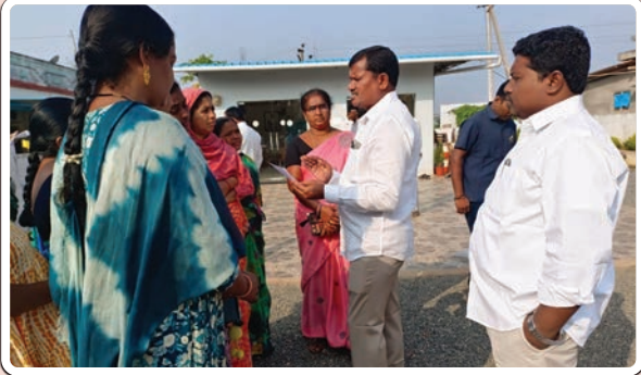
దమ్మపేట, డిసెంబర్ 13 (ప్రజాజ్యోతి):

అస్వారావుపేట నియోజకవర్గ శాసనసభ్యులు జారే ఆదినారాయణ శుక్రవారం మండల పరిధిలోని గండుగులపల్లి గ్రామంలో గల క్యాంప్ కార్యాలయం నందు ప్రజాపాలన కార్యక్రమాన్ని నిర్వహించారు. ఈ క్రమంలో వెలుగు సీసీలు, వివోవి లు, డ్వాక్రా ఉద్యోగులు ఎమ్మెల్యే ను మర్యాదపూర్వకంగా కలిసి, తమ సమస్యల పరిష్కారానికి వినతిపత్రాన్ని అందజేశారు. ఉద్యోగుల సమస్యలను కులంకషంగా ఆలకించిన ఎమ్మెల్యే జారే సానుకూలంగా స్పందించి, సమస్యలను ప్రభుత్వం దృష్టికి తీసుకువెళ్ళి, వారికి రావలసిన పెండింగ్ వేతనాలు త్వరగా విడుదలయ్యే విధంగా కృషిచేస్తానని హామీ ఇచ్చారు.