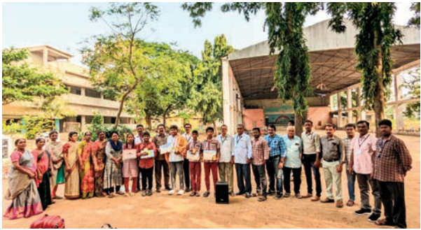
పాధ్యాయులు విద్యార్థులు పాల్గొన్నారు.