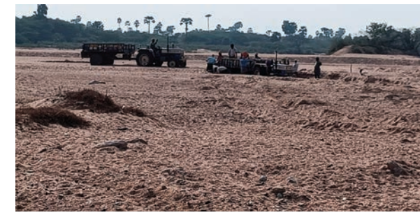
జోరుగా సాగుతుందని స్థానిక ప్రజలు ఆరోపిస్తున్నారు. ప్రభుత్వ

నాగారం నవంబర్ 29 ప్రజా జ్యోతి. మన ఇసుక మన వాహనం పాలసీ మాటున అక్రమ ఇసుక రవాణా