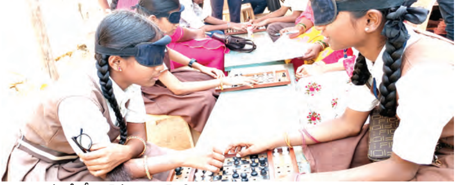
* చివ్వాంగుల్లో క్రీడా ప్రయోజనాలను చెలికి తీయడానికి ప్రభుత్వం క్రీడలు నిర్వహణ