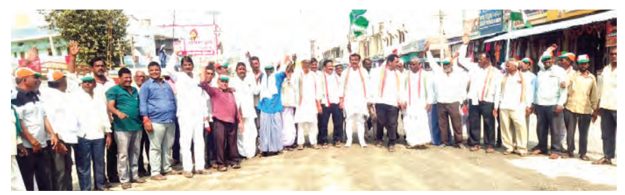
అసలు సుసరైన, కాంగ్రెస్ కార్యకర్తకు నియమించాలి