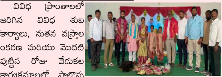
కుత్బుల్లాపూర్ నవంబర్ 25(ప్రజా జ్యోతి )