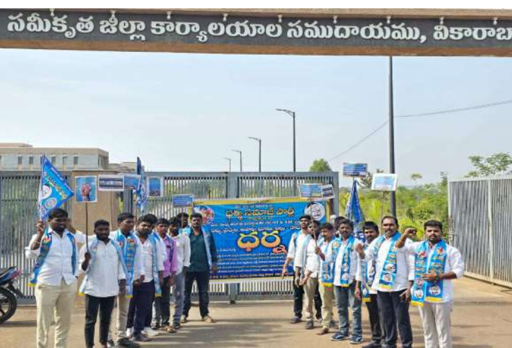
వికారాబాద్ ప్రతినిధి, నవంబర్ 25(ప్రజా జ్యోతి):