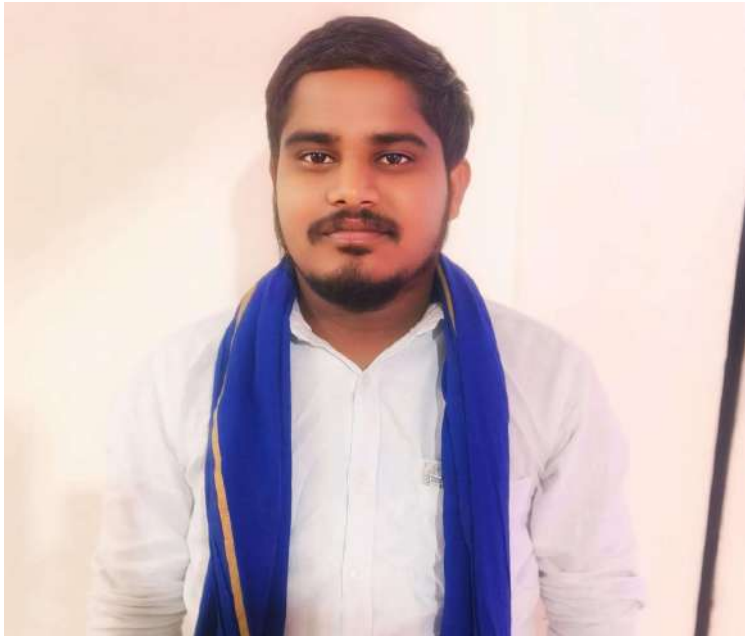
పీఠిక ప్రతిజ్ఞ చేసేలా అధికారికంగా నిర్వహించి, పండగ లాగ జరిపి బాబాసాహెబ్ అంబేద్కర్ ఉద్యమ వారసత్వాన్ని కొనియాడాలని అన్నారు.