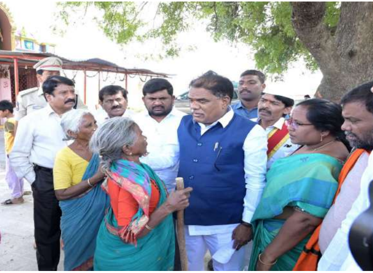
వికారాబాద్ ప్రతినిధి, నవంబర్ 25( ప్రజా జ్యోతి):