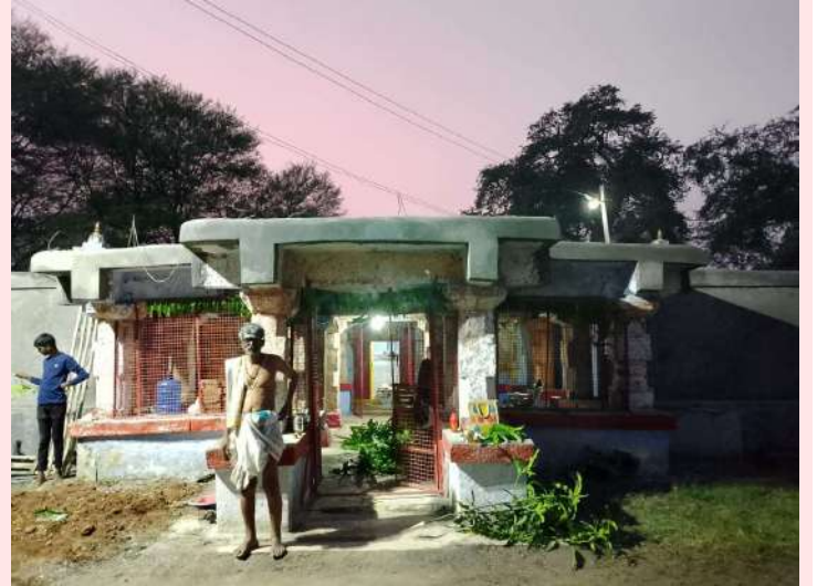
శివ్వంపేట ప్రజాజ్యోతి నవంబర్ 23