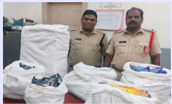
మక్తల్ నియోజకవర్గ ప్రతినిధి, నవంబర్ 23 (ప్రజా జ్యోతి):

నారాయణపేట జిల్లా మక్తల్ మండల కేంద్రంలో వేరువేరుగా మూడు చోట్ల ప్రభుత్వ నిషేధిత అంబర్ జర్డ గుట్కా ప్యాకెట్లను టాస్ట్ ఫోర్స్, మక్తల్ పోలీసులు సంయుక్తంగా దాడులు నిర్వహించి గుట్కా ప్యాకెట్లను పట్టుకొని పోలీస్ స్టేషన్ కు తరలించారు. ఈ సందర్భంగా మక్తల్ ఎస్ఐ 2 ఆచారి మాట్లాడుతూ ప్రభుత్వం నిషేధించిన గుట్కా ప్యాకెట్లను మక్తల్ కు తీసుకువస్తున్న సమయంలో మొత్తం ముగ్గురి వద్ద 28,040/- రు. గుట్కాలు పట్టుకొని ముగ్గురు వ్యక్తులపై కేసులు నమోదు చేసి దర్యాప్తు చేస్తున్నామని ఎస్ఐ గారు తెలిపారు. మక్తల్ పోలీస్ స్టేషన్ పరిధిలో ఎవరైనా అక్రమంగా ప్రభుత్వ నిషేధిత గుట్కా ప్యాకెట్లను నిల్వ ఉంచిన ప్రజలకు అమ్మిన రవాణా చేసిన అట్టి వ్యక్తులపై చట్ట ప్రకారం కఠిన చర్యలు తీసుకోవడం జరుగుతుందని ఎస్ఐ హెచ్చరించారు.