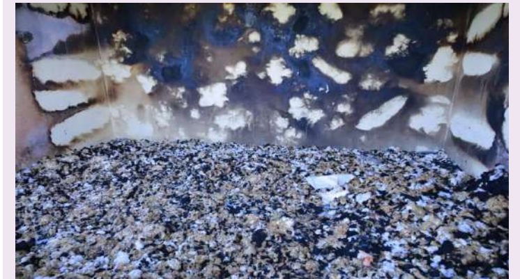
నాగర్ కర్నూల్, (టౌన్)నవంబర్ 23 (ప్రజా జ్యోతి)