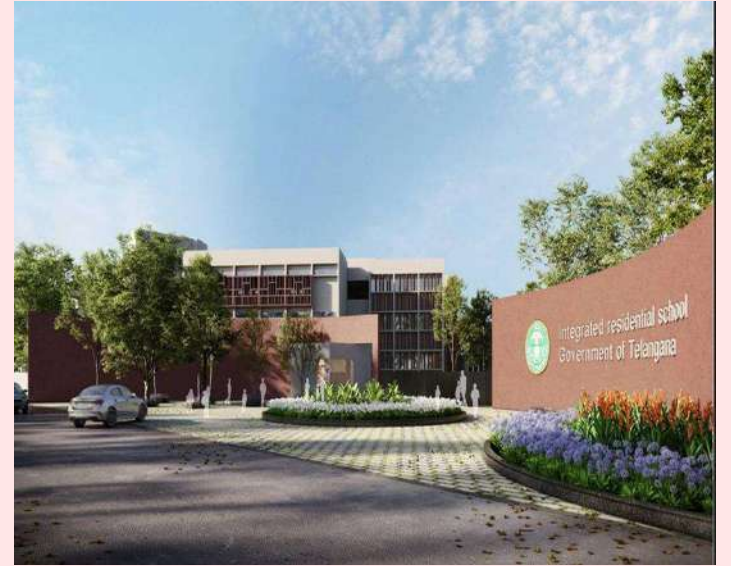
వికారాబాద్ ప్రతినది, నవంబర్ 23 ప్రజా జ్యోతి:

తెలంగాణ రాష్ట్ర ప్రభుత్వం ప్రతిష్టాత్మకంగా ప్రవేశపెట్టిన ఇంటి గ్రేటెడ్ పాఠశాలలను వికారాబాద్ జిల్లాకు రెండు పాఠశాలలు మంజూరు చేసినట్లు విద్యాశాఖ ద్వారా తెలిసింది. రాష్ట్రవ్యాప్తంగా పేజ్-2 లో 26 అసెంబ్లీ నియోజకవర్గాల్లో 26 యంగ్ ఇండియా ఇంటి గ్రేటెడ్ రెసిడెన్షియల్ స్కూల్ కాంపైక్స్ ల స్థాపనకు ప్రభుత్వం సూత్రప్రాయంగా ఆమోదం తెలిపింది. అందులో భాగంగా వికారాబాద్ అసెంబ్లీ పరిధిలో ఒకటి, మరొకటి తాండూర్ అసెంబ్లీ నియోజకవర్గానికి మంజూరైనట్లు విద్యాశాఖ ద్వారా తెలియజేశారు. సకల వసతులతో కూడిన ఈ పాఠశాలలో విద్యార్థులకు మంచి విద్యతో పాటు మంచి ఫౌన్డికహారంతో కూడిన భోజనాన్ని అందించడం అదే ప్రాంగణంలో ఉపాధ్యాయులు విద్యార్థులు ఒకే చోట ఉండే లాగున అన్ని వసతులు నిర్మించ నున్నట్లు తెలిపారు. ఏది ఏమైనా ఇంటిగ్రేటెడ్ పాఠశాలలు వస్తే మంచి మెరుగైన విద్యతో పాటు కార్పొరేట్ పాఠశాలలను మైమరి పించేలా ఉంటాయని భావిస్తున్నారు.