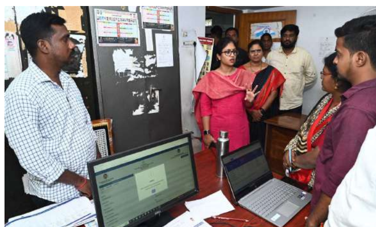
నారాయణపేట జిల్లా ప్రతినిధి ప్రజాజ్యోతి నవంబర్ 23: