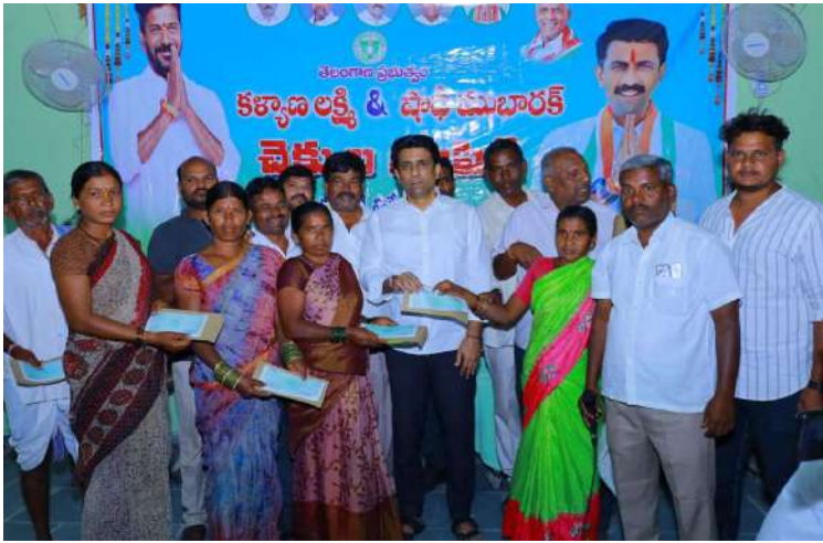
-త్వరలో ఇందిరమ్మ ఇండ్లు, కొత్త పెన్నన్ను -ఎమ్మెల్యే కూచుకుళ్ల రాజేష్ రెడ్డి నాగర్ కర్నూల, నవంబర్ 23 (ప్రజాజ్యోతి)

కళ్యాణ లక్ష్మి, షాదీ ముబారక్ లబ్ధిదారుల ఎంపికలో ఎవరైనా దళారులుగా వ్యవహరించి డబ్బులు వసూలు చేస్తే వారిపై క్రిమినల్ చర్యలు తీసుకుని కట్కటాల పాలు చేస్తామని ఎమ్మెల్యే డాక్టర్ కూచుకుళ్ల రాజేష్ రెడ్డి హెచ్చరించారు. శనివారం బిజినెస్ పబ్లి మండల కేంద్రంలో ముఖ్యమంత్రి సహాయాన్ని చెక్కులతో పాటు కళ్యాణ లక్ష్మి, షాదీ ముబారక్ చెక్కులను పంపిణీ చేశారు. ఈ సందర్భంగా ఏర్పాటు చేసిన సమావేశంలో ఎమ్మెల్యే మాట్లాడుతూ కొంతమంది లబ్ధిదారుల ఎంపిక చేసేస్తామని డబ్బులు వసూలు చేస్తున్నట్లు తన దృష్టికి వచ్చిందని అలాంటి చర్యలకు ఎవరైనా పాల్పడిన ఎంతటి వారినైనా వదిలేది లేదని, రాజకీయాలకు అతీతంగా తెలంగాణ రాష్ట్రంలో గతంలో ఎన్నడూ లేని