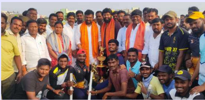
అలంపూర్ డివిజన్ (ప్రజాజ్యోతి) నవంబర్ 23: