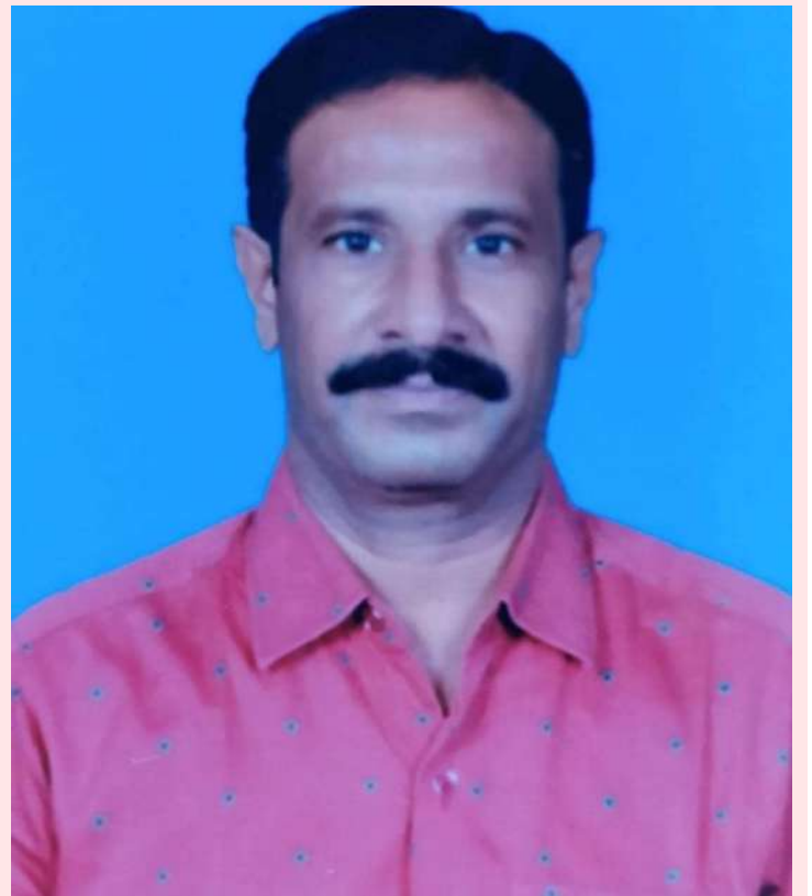
నాగర్ కర్నూల్, నవంబర్ 23 (ప్రజా జ్యోతి)