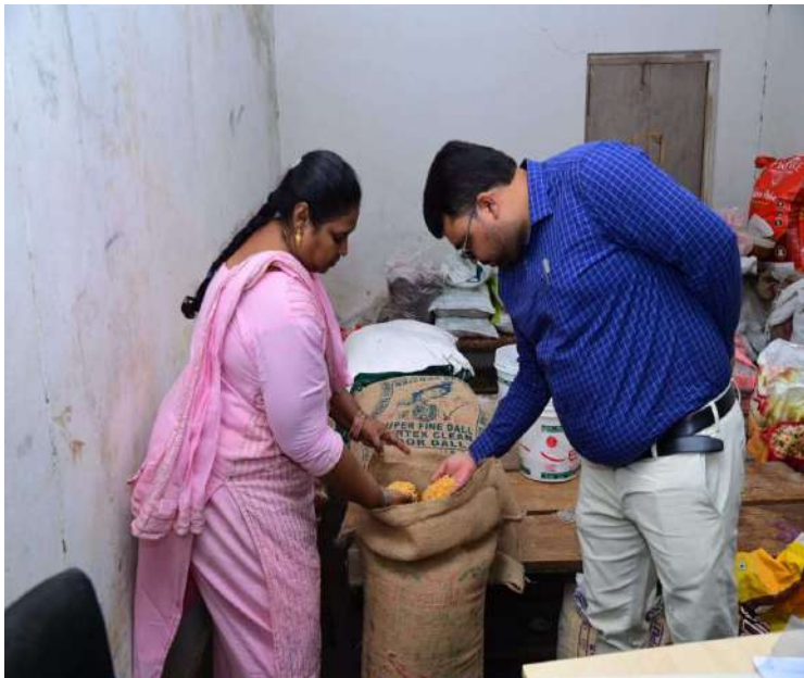
- జిల్లా కలెక్టర్ బాదావత్ సంతోష్

నాగర్ కర్నూల్ నవంబర్ 23 (ప్రజా జ్యోతి ప్రతినిధి)