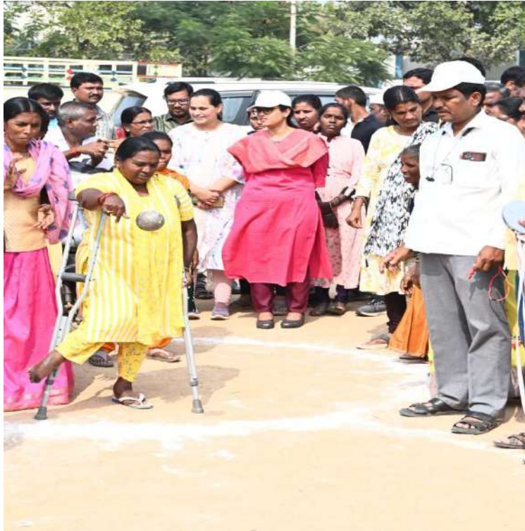
-నారాయణపేటలో దివ్యాంగుల జిల్లా స్థాయి క్రీడా పోటీలను ప్రారంభించిన కలెక్టర్