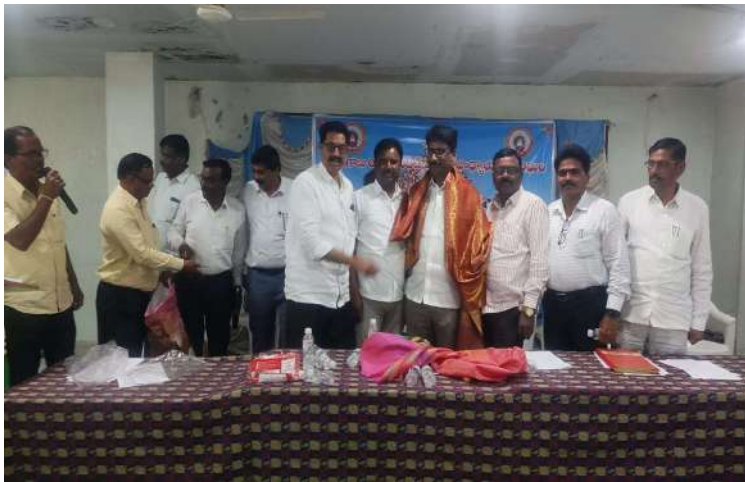
తుకారాములు అధికారులుగా వ్యవహరించారు.