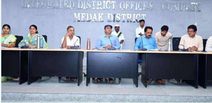
మెడక్ (ప్రజాజ్యోతి), 23 నవంబర్-2024