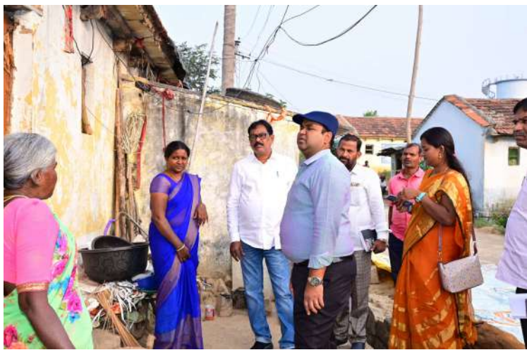
-పైలెట్ ప్రాజెక్టు కింద మన మెడక్ జిల్లాకు చోటు దక్కడ అభినందనీయం