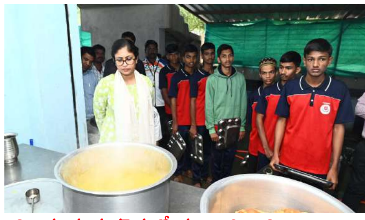
-విద్యార్థులకు శుభ్రమైన భోజనం అందించాలి