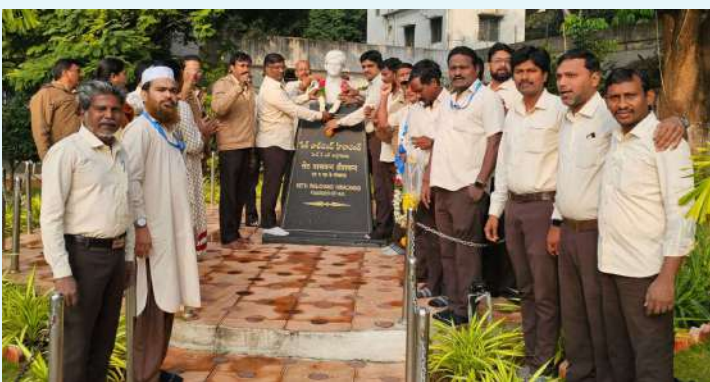
బాలానగర్, నవంబర్ 23 (ప్రజా జ్యోతి) :

-జన్మదినోత్సవంలో కొనియాడిన హెచ్ఎ డబ్ల్యూ యూనియన్ నేతలు