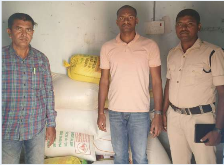
( నంగునూరు ) ప్రజా జ్యోతి