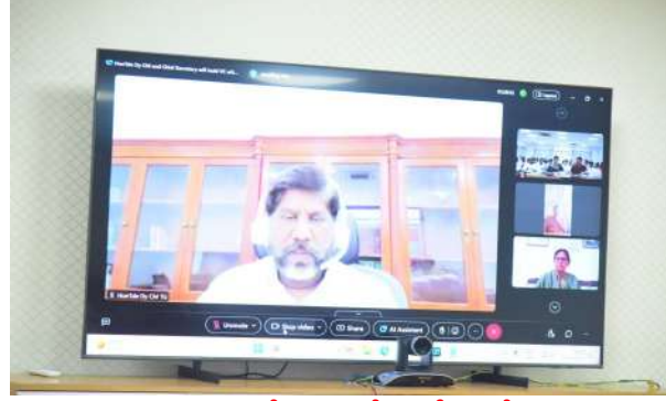
-ఇంటింటి కుటుంబ సర్వే మన దేశంలో జరిగే అతిపెద్ద కార్యక్రమం

-ఉప ముఖ్యమంత్రి మల్లు భట్టి విక్రమార్క సంగారెడ్డి , నవంబర్ 9 , ప్రజా జ్యోతి న్యూస్ ప్రతినిధి :-