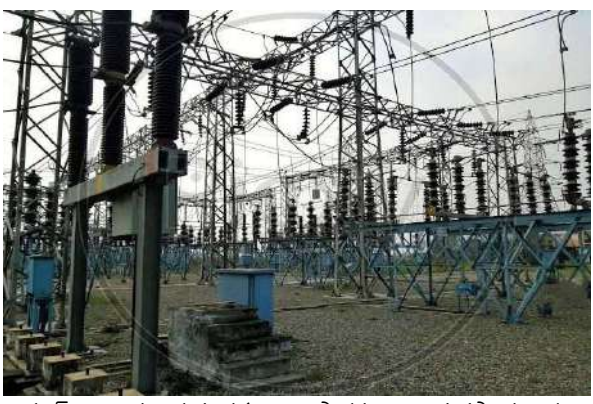
విద్యుత్ అంతరాయమునకు వ్యాపారస్తులు, వ్యవసాయదారులు, ప్రజలు, విద్యుత్ వినియోగదారులు సహకరించాలని కోరారు.

తుర్కయాంజల్ సబ్ స్టేషన్ పరిధిలో చెట్ల కొమ్మలు తొలగించే కార్యక్రమం చేపట్టడంతో సస్పెన్షన్ వ్యవధిలో విద్యుత్ సరఫరాకు అంతరాయం కలుగుతుందని ఇంజనీర్ ఏఈ రాములు శనివారం నాడు ఒక ప్రకటనలో పేర్కొన్నారు. ఈ సందర్భంగా ఆయన మాట్లాడుతూ తుర్కయాంజల్ సబ్ స్టేషన్ పరిధిలో ఉన్న 113వి కమ్మగూడ ఫీడర్ లోని కమ్మగూడ, ఈస్ట్ సూరజ్ నగర్, సుభాష్ నగర్, శాంతి నగర్, రాజ రంజిత్ హోమ్స్, నవ భారత్ కాలనీ, అపాల్ కాలనీ, ఆర్టిసీ కాలనీ, వశిష్ట , టీవర్స్ కాలనీ, సెంట్ పాల్స్ స్కూల్ లలో సోమవారం ఉదయం 11గంటల నుండి సాయంత్రం 4:30 గంటల వరకు విద్యుత్ సరఫరా నిలిపివేస్తున్నట్లు తెలిపారు. చెట్ల కొమ్మలు తొలగించడం తో పాటు చిన్న చిన్న నిర్వహణ మరమ్మత్తు పనుల కారణంగా విద్యుత్ అంతరాయం ఉంటుందని సూచించారు. ఈ