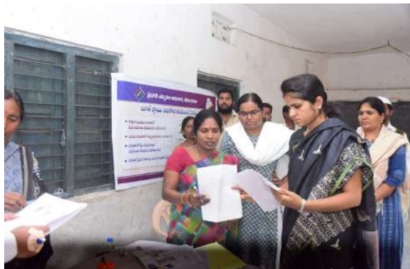
-జిల్లా కలెక్టర్ క్రాంతి వల్లూరు

సంగారెడ్డి , నవంబర్ 9 , ప్రజా జ్యోతి న్యూస్ ప్రతినది :-