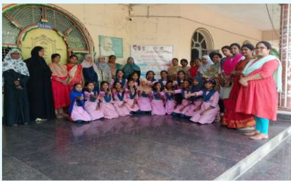
సిద్దిపేట టౌన్ ప్రజాజ్యోతి :

గురుకులాల్లో చదువుతున్న విద్యార్థులకు మెస్ చార్జులను పెంచుతు ఇటీవల తెలంగాణ ముఖ్యమంత్రి సీఎం రేవంత్ రెడ్డి నిర్ణయం తీసుకోవడంతో సిద్దిపేట తెలంగాణ మైనారిటీ గురుకులం విద్యార్థులు హార్షం వ్యక్తం చేశారు. ఈ సందర్భంగా సీఎం రేవంత్ రెడ్డికి కృతజ్ఞతలు తెలిపారు. గురుకుల ఉపాధ్యాయులతో కలిసి విజయనంకేతం చూపేట్టారు..