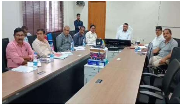
-ప్రజా ప్రతినిధులను భాగస్వామ్యం చేయాలి