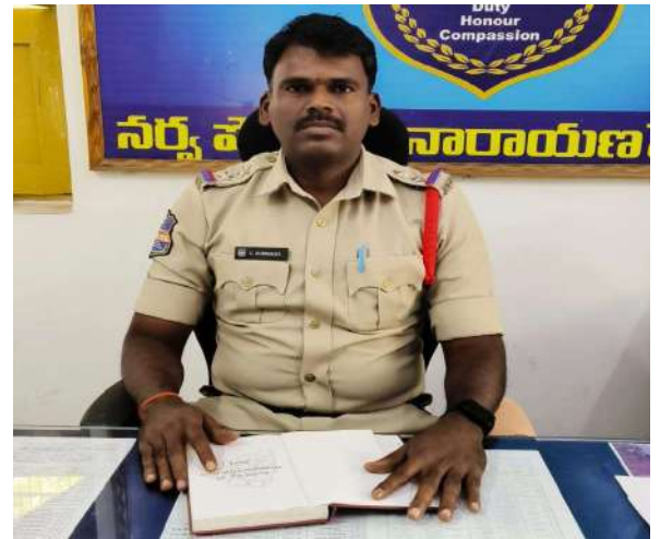
అపరిచిత వ్యక్తులు వచ్చినట్లు అనుమానం వస్తే 100 ఫోన్ చేయాలని సూచించారు.