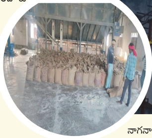
నాగనాథ్, సిబ్బంది పాల్గొన్నారు.

ప్రజా జ్యోతి వేల్పూర్ : నిజామాబాద్ జిల్లా వేల్పూర్ లోని వజ్ర ఇండస్ట్రీస్ పై ఎన్ ఫోర్స్ మెంట్ అధికారులు గాడి చేశారు. గురువారం రాత్రి నుంచి శుక్రవారం మధ్యాహ్నం వరకు తనివీలు కొనసాగాయి. పోలీసుల సాయంతో గాడి చేసిన ఎన్ ఫోర్స్ మెంట్ అధికారులు 560 క్వింటాళ్ల పీడీఎస్ బియ్యాన్ని స్వాధీనం చేసుకున్నారు. ఎన్ ఫోర్స్ మెంట్ డీటీ శ్రీనివాస్, ఎస్సై