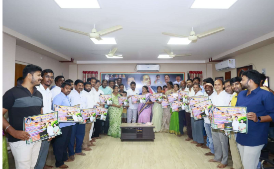
సత్తుపల్లి నవంబర్ 2 ప్రజా జ్యోతి : ఆశ స్వచ్ఛంద సంస్థ ఆధ్వర్యంలో క్రికెట్ పోటీలను ఈనెల 8 నుంచి రాష్ట్ర స్థాయి టోర్నమెంట్ నిర్వహి

ఆశ స్వచ్ఛంద సంస్థ ఆధ్వర్యంలో క్రికెట్ పోటీలు.