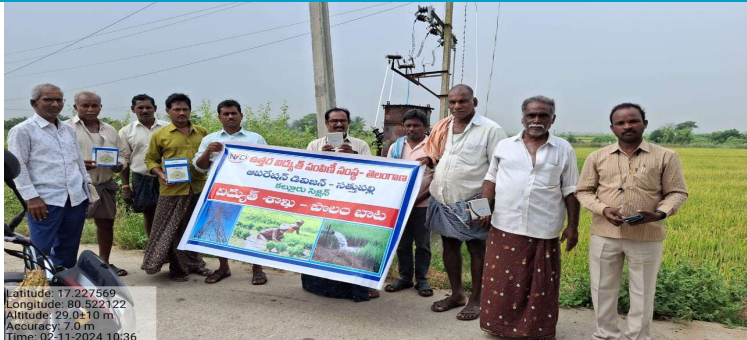
అవగాహన కల్పించటం జరిగింది. ఈ కార్యక్రమంలో కల్లూరు విద్యుత్ శాఖ సహాయ ఇంజనీర్ మరియు సిబ్బంది పాల్గొనటం జరిగింది.

కల్లూరు నవంబర్ 02(ప్రజా జ్యోతి): విద్యుత్ శాఖ వారి ఆదేశానుసారం కల్లూరు మండలం లోని పుల్లయ్య బంజర తూర్పు లోకారం మరియు పడమర లోకారం గ్రామాలలోని వ్యవసాయ వినియోగ దారులతో పాలంబాట కార్యక్రమము నిర్వహించటం జరిగినది. ఈ కార్యక్రమములో భాగంగా వ్యవసాయ వినియోగదారులకు వ్యవసాయ మోటర్లకు కెపాసిటర్ల వినియోగం వలన కలుగు ప్రయోజనములపై అవగాహన కల్పించటం జరిగినది. విద్యుత్ ప్రమాదాలపై వారికి అవగాహన కల్పించి వారి వ్యవసాయ మోటర్లు విద్యుత్ సరఫరాలో ఏవైన లోపాలు తలెత్తినట్లయితే స్వంతగా చేసుకోకుండా విద్యుత్ సిబ్బంది ద్వారా మాత్రమే సరిచేయించుకోవలసిందిగా