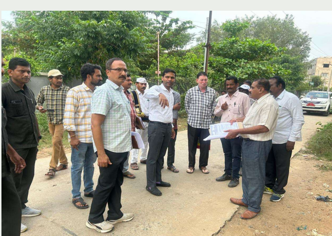
జిల్లా కలెక్టర్ ముజమ్మిల్ ఖాన్