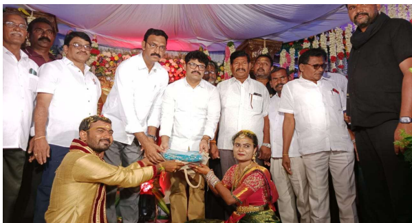
పలు వివాహాది శుభకార్యాక్రమలకు హాజరు