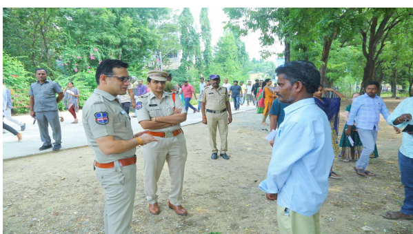
గ్రూప్ -3 ప్రిలిమ్స్ పరీక్ష కేంద్రాల వద్ద ఏర్పాటు చేసిన పోలీస్ బందోబస్తు ఏర్పాట్లను పోలీస్ కమిషనర్ సునీల్ దత్ పరిశీలించారు.

ఖమ్మం ప్రతినిధి ప్రజా జ్యోతి : ఖమ్మం పోలీస్ కమిషనరేట్ పరిధిలోని 87 పరీక్ష కేంద్రాలలో జరుగుతున్న గ్రూప్ - మూడు పరీక్షల నేపథ్యంలో