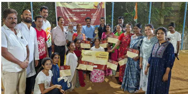
గ్రామీణ యువత క్రీడ రంగంలో రాణించాలి

రఘునాథపాలెం ప్రజా జ్యోతి : నేటి సమాజంలో మహిళలు వయసుతో సంబంధం లేకుండా పురుషులతో సమానంగా క్రీడల్లో రాణించడం అభినందనీయమని పలువురు హార్షించగా విషయం ఈషా ఫౌండేషన్ ఆధ్వర్యంలో ఖమ్మం నగరంలోని సర్దార్ పటేల్ క్రీడా మైదానంలో నిర్వహించిన పూర్తిస్థాయి క్రీడా సందడి కొనసాగింది. త్రో బాల్ ఆట లో రఘునాథపాలెం మండలం పరిధిలోని 27 టీమ్స్ తో గ్రామాల్లో త్రోబాల్ కోయిచలక,వారియర్స్ టీము మొదటి బహుమతి గెలుపొందిగా, ఆ తరువాత రెండవ పోటీ లో భాగంగా పాపటపల్లి, కామంచికల్, రైల్వే కాలనీ పాపడపల్లి గ్రామాల నుండి జట్ల మధ్య హోరాహోరీగా సాగిన పైసెల్లో సమిష్టిగా రాణించడంతో విజయం సాధించారు. వయసుతో