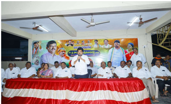
గెలుపు మనదే కావాలి, కష్టపడిన ప్రతి ఒక్కరికీ ఫలితం ఉంటుంది.