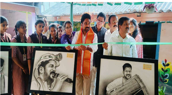
విద్యార్థుల్లో పెన్సిల్ ఆర్ట్ తో స్ఫూర్తి నింపిన చిత్రాలు.