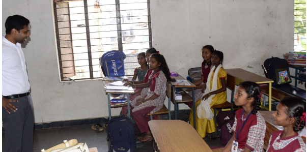
జిల్లా కలెక్టర్ ముజమ్మిల్ ఖాన్

3 ఫేజ్, విద్యుత్ ఏర్పాట్ల పనుల కోసం హెడ్ మాస్టర్ కు 50 వేల రూపాయల చెక్కు అందజేత ఖమ్మం రూరల్ మండలం జలగంగనగర్ జెడ్పీహెచ్ఎస్ పాఠశాలను తనిఖీ చేసిన జిల్లా కలెక్టర్