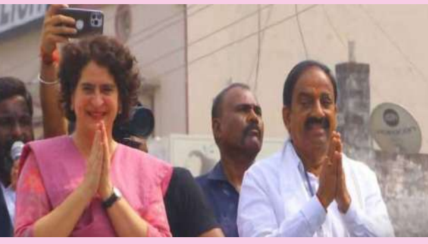
ఖమ్మం ప్రతినిధి ప్రజా జ్యోతి

కేరళలో వయనాడ్ లోక్ సభ ఉప ఎన్నికల్లో ప్రియాంక గాంధీ ఘనవిజయం సాధించడం పట్ల రాష్ట్ర వ్యవసాయ శాఖ మాత్యులు తుమ్మల నాగేశ్వరరావు హార్షం వ్యక్తం చేశారు. వయనాడ్ ప్రజల తీర్పు అమోఘం అన్నారు. మొదటి సారి ప్రత్యక్ష రాజకీయాల్లో ఆరెగంటం చేసిన ప్రియాంక గాంధీ అత్యధిక మెజరిటీతో ఘన విజయం సాధించడం పట్ల అక్కడి ప్రజలు గాంధీ కుటుంబం పట్ల, నెహ్రూ వారసత్వం పట్ల ఎంత విధేయత చూపుతున్నారో మరో మారు నిరూపితం అయిందన్నారు. వయనాడ్లో రాహుల్ గాంధీ రికార్డును ప్రియాంక గాంధీ బ్రేక్ చేసి ప్రజల అభిమానాన్ని చూరగొన్నారు. విద్యా వంతులైన కేరళ ప్రజలు కాంగ్రెస్ కు అండగా ఉండటం వారిపట్ల గౌరవాన్ని, నమ్మకాన్ని సూచిస్తుందన్నారు. రాజ్యాంగ పరిరక్షణ కు గాంధీ కుటుంబంతోనే సాధ్యం అని కేరళ ప్రజలు విశ్వసిస్తున్నారని తెలిపారు. ప్రియాంక గాంధీ కి అత్యధిక మెజరిటీ ఇచ్చి గెలిపించిన వయనాడ్ ప్రజలకు తెలంగాణ ప్రజల తరఫున మంత్రి తుమ్మల ప్రత్యేక ధన్యవాదాలు తెలిపారు.