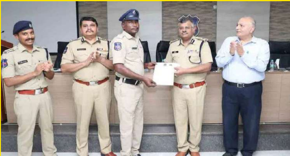
కొత్తగూడెం క్రెం, నవంబర్ 23

గంజాయి అక్రమ రవాణా కేసుల్లో నిందితులకు శిక్షపడేలా కృషి చేసిన జిల్లా పోలీస్ అధికారులు, సిబ్బందికి డీజీపీ జితేందర్ హైదరాబాద్ లోని తన కార్యాలయంలో శనివారం రివార్డులను అందజేశారు. భద్రాచలం పోలీస్ స్టేషన్ పరిధిలోని అధికారులు, సిబ్బందిని డీజీపీ ప్రశంసించారు. రివార్డులు అందుకున్న అధికారులను జిల్లా ఎస్పీ బిరుదరాజు రోహిత్ రాజు అభినందిస్తూ శనివారం పత్రికా ప్రకటన విడుదల చేశారు. - మగతా3లో